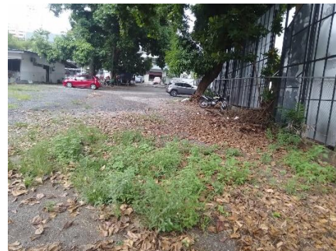
Fotos Nº 5, 6, 7, 8, 9, 10: Vista general. Tramo prospectado. Terreno plano, alterado por su uso como área de aparcamiento de vehículos. Vegetación entre gramíneas, herbazales