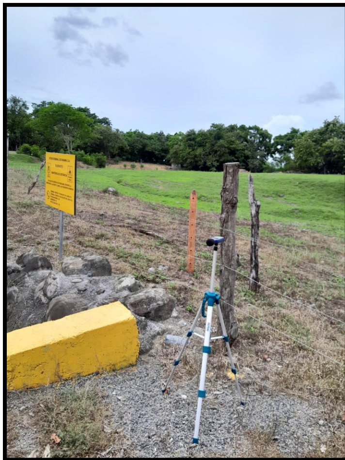
Cerca límite de la propiedad más cercana Coordenadas Datum WGS 84 2937700E; 909920N Turno: DIURNO