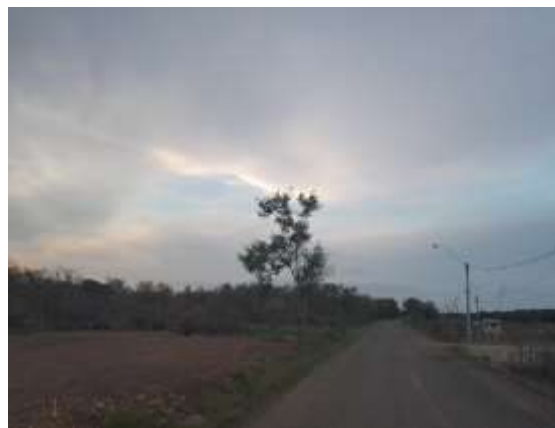
Fotos de 1 a 6. Vista panorámica del sitio de proyecto, despejada de vegetación arbórea y suelo removido hasta por debajo suelo estéril. Se observa la capa de tosca que ha sido colocada.