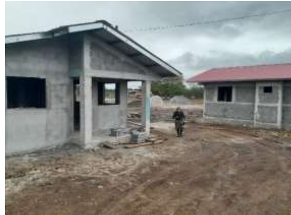
Fotos de 7 a 10. Inspección general del polígono del proyecto, en áreas despejadas y las viviendas en proceso de construcción.