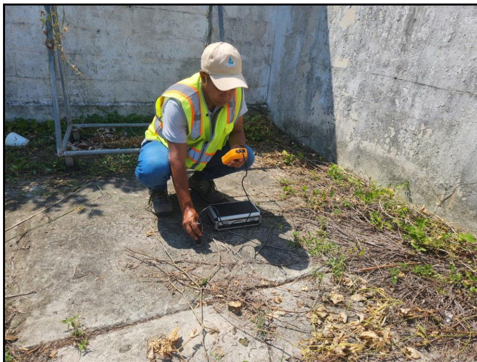
Sitio # 1: DENTRO DEL ÁREA DEL PROYECTO (RESIDENCIA MÁS PRÓXIMA)