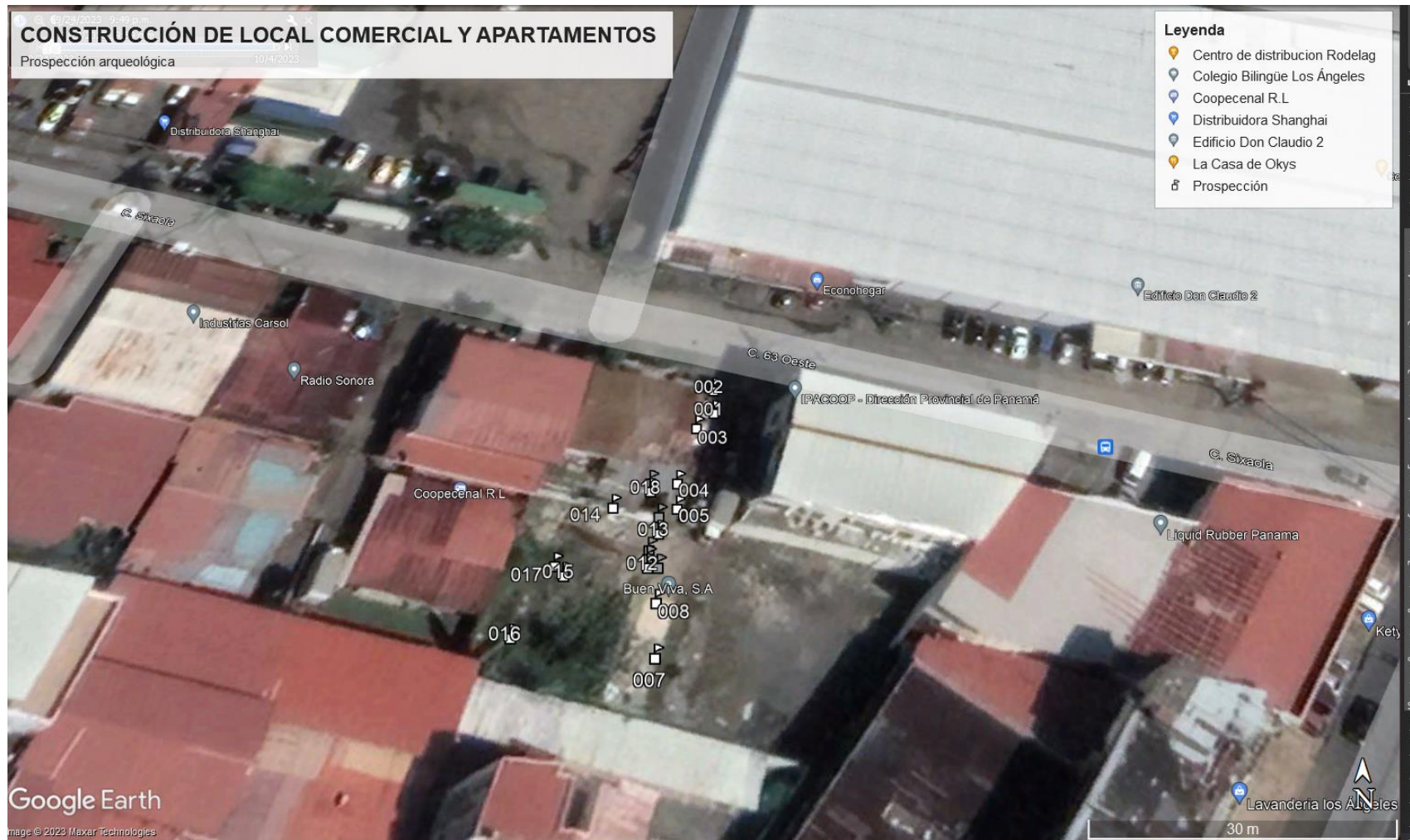
Mapa 1: Ubicación Regional