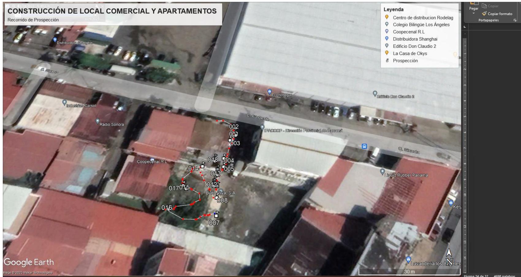
Mapa 2: Recorrido de Prospección