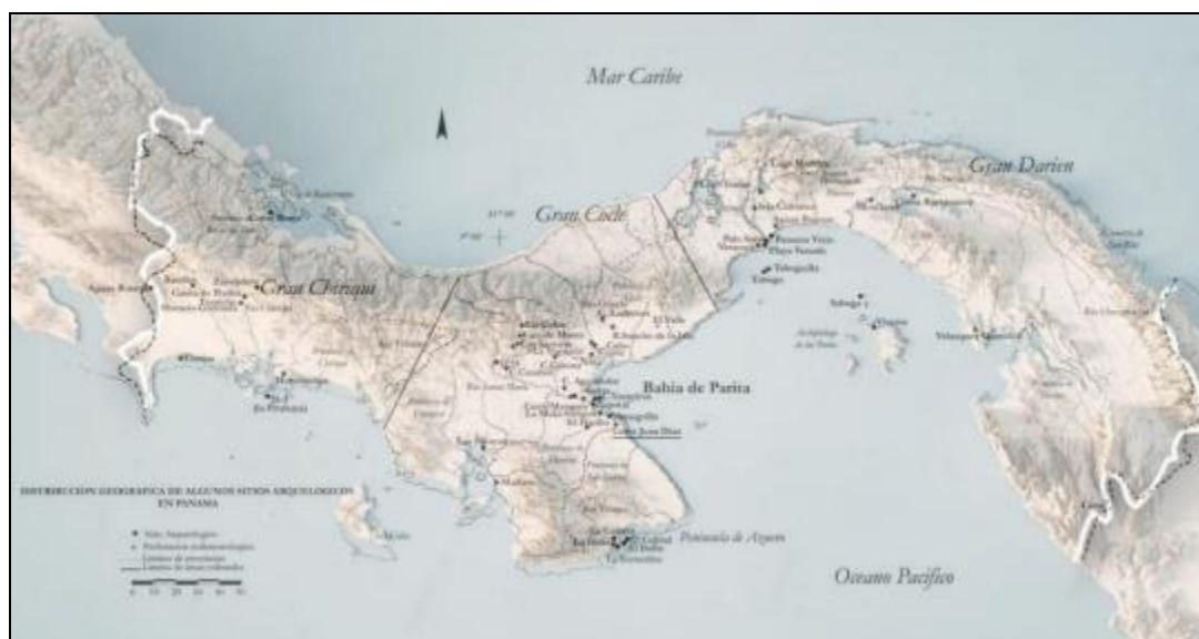
Ilustración 1: Mapa de zonas arqueológicas de Panamá