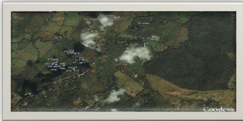
Foto B- Señalamiento del área de los hallazgos en el polígono