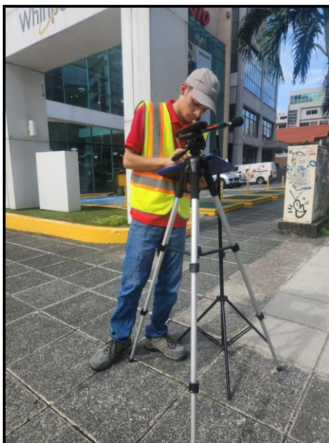
Punto # 1: CALLE 50 FRENTE A PANAFOTO.