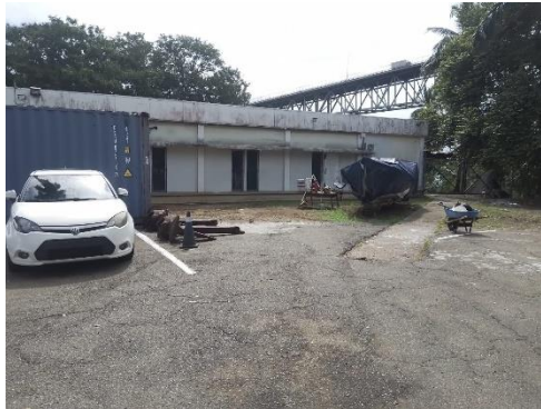
Fotos N°1, 2, 3 y 4: Vista general. Tramo prospectado. Terreno plano alterado con estructuras modernas y área de estacionamiento. Sin vegetación.