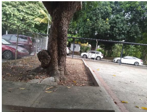
Fotos Nº 5, 6, 7: Vista general, Tramo prospectado. Terreno plano visiblemente alterado. Estructuras modernas. Sin Vegetación, solamente un árbol en área intervenida para estacionamiento.

El siguiente cuadro muestra las coordenadas tomadas durante la prospección arqueológica: