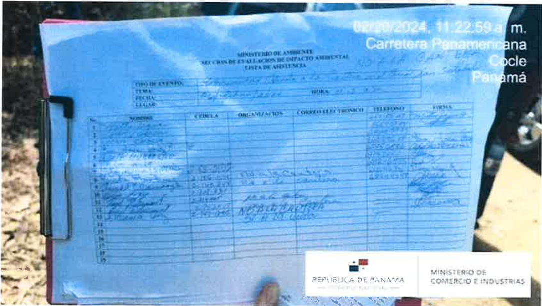
Foto #3. Lista de moradores que se manifestaban en contra del proyecto.