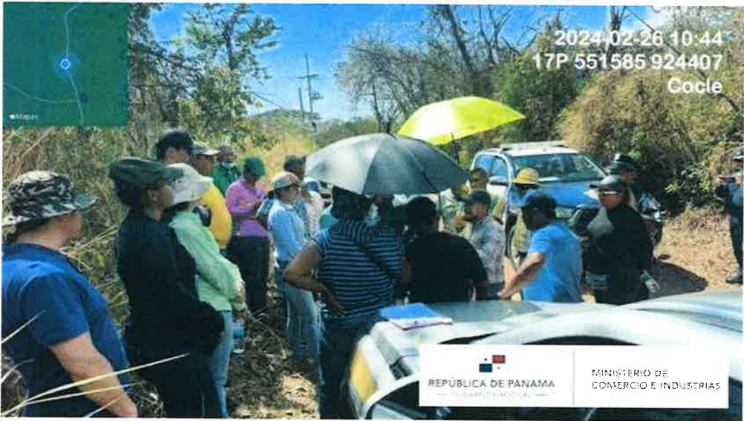
Foto #1. Miembro de la comunidad