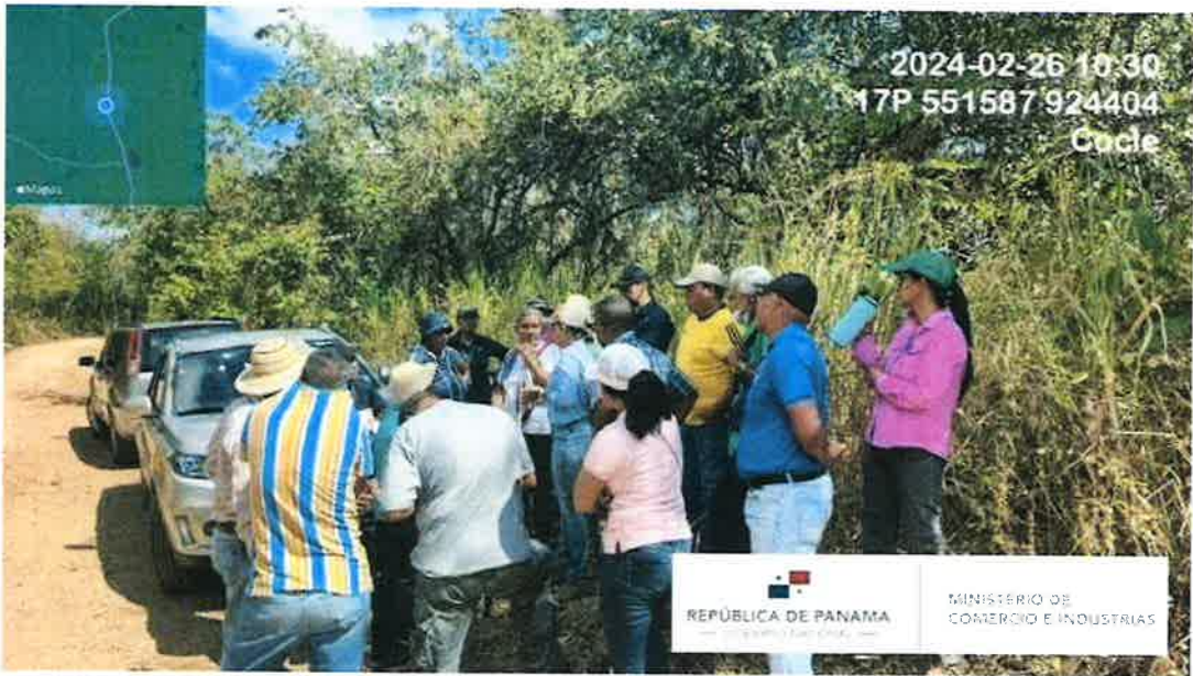
Foto #2. Reunión con la comunidad en la entrada al proyecto.