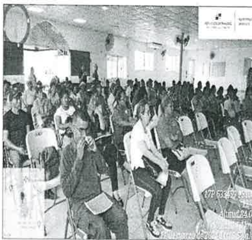
Imagen N° 3: Vista parcial de la Participación Ciudadana, Instituciones Públicas y Organizaciones Civiles de Panamá Oeste.