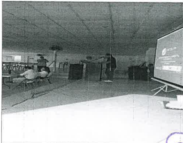
Imagen N° 2: Inicio de la presentación por parte del equipo consultor