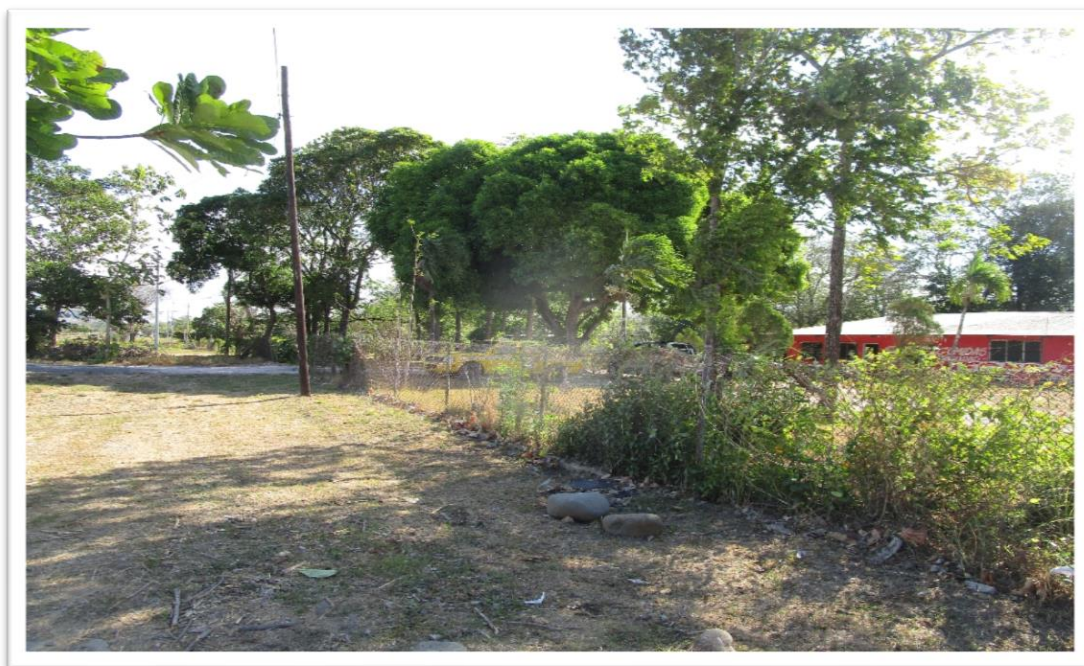
FOTO 2. VISTA DEL TERRENO DONDE SE DESARROLLARÁ EL PROYECTO.