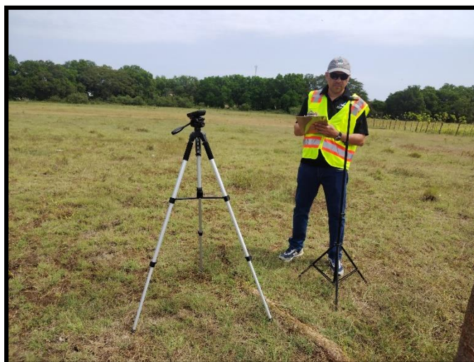
Punto # 1: DENTRO DEL POLÍGONO DEL PROYECTO