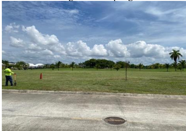
Vista general del polígono