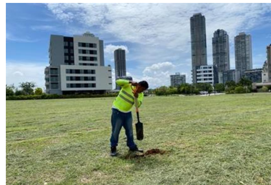
Coordenadas de los sondeos realizados. Datum consignado.