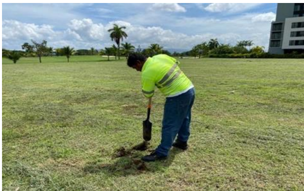
Detalle de algunos sondeos realizados