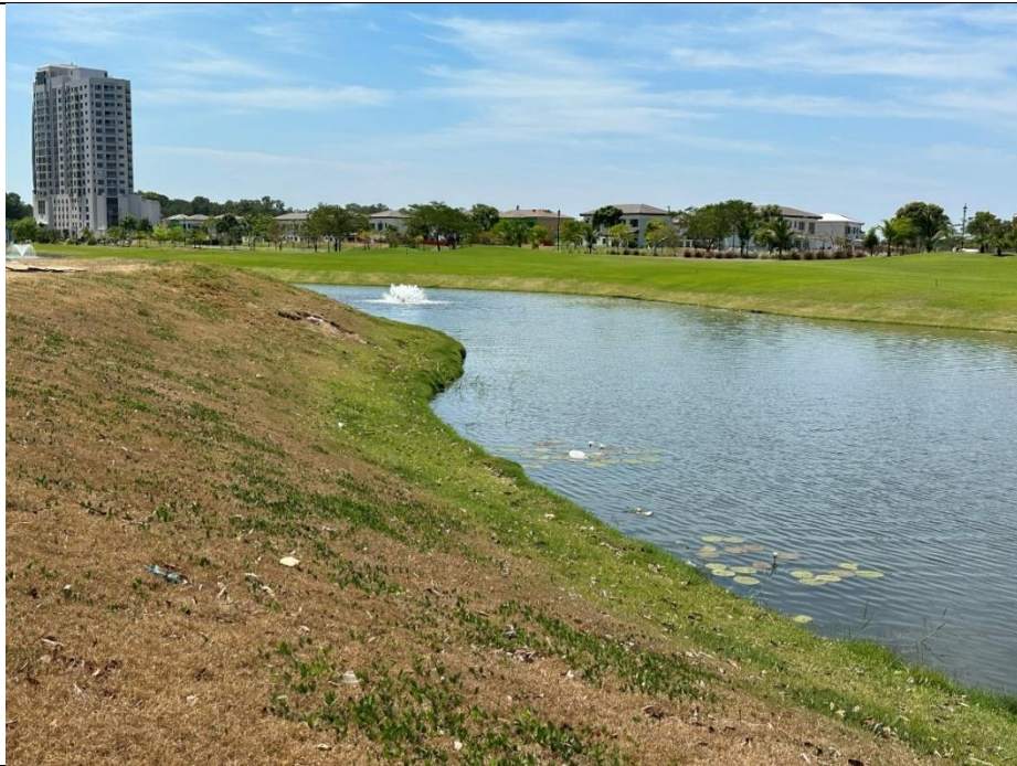
Foto No. 6. Lago artificial cercano al proyecto.