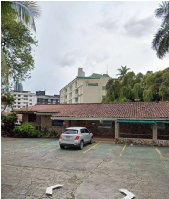
Dentro del área del proyecto