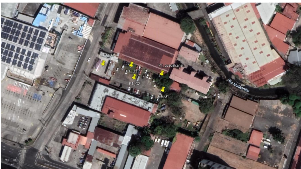
VISTA SATELITAL N° 1. Proyecto “COMPLEJO DEPORTIVO GUADALCANAL”