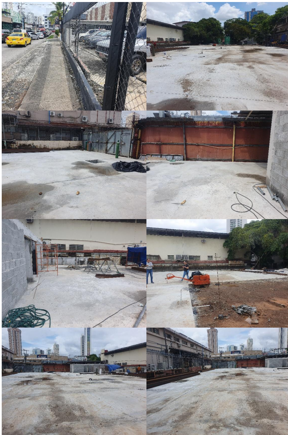
Fotos 1, 2, 3, 4, 5, 6, 7, 8, 9, 10, 11 y 12: Vistas generales. El área de estudio es un entorno urbano con terreno plano mayormente cubierto de cemento. Aunque hay algunas áreas con tierra expuesta y un árbol frutal, la vegetación es escasa debido a la intervención humana. También se encuentran residuos de materiales de construcción dispersos. El terreno está delimitado por una cerca artificial y colinda con edificaciones modernas habitadas. No hubo hallazgos.