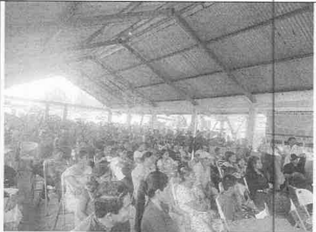
Ilustración 2: Público de la comunidad presente en el foro público