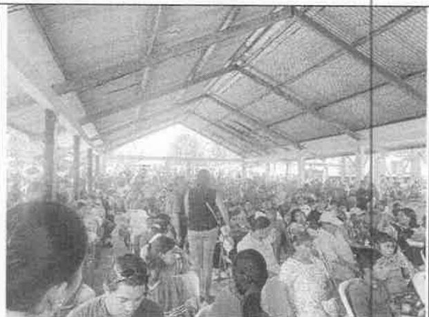
Ilustración 4: Evidencia de que la comunidad emitió sus comentarios e inquietudes.

A continuación, se anexa la lista de asistencia del Foro público realizado en el corregimiento de Calovébora, Distrito de Santa Fé, Provincia de Veraguas, correspondiente al proyecto denominado “ LÍNEA CHIRIQUI GRANDE-PANAMA III, 500 KV ”, a desarrollarse en las provincias de Bocas del Toro, Comarca Ngäbe Bugle (Región Nö Kribo), Provincia de Veraguas, Provincia de Coclé, Provincia de Colón, Provincia de Panamá Oeste y Provincia de Panamá, cuyo promotor es la EMPRESA DE TRANSMISIÓN ELÉCTRICA, S.A. (ETESA) .