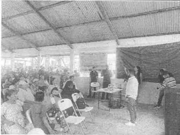
Ilustración 1: Equipo del Ministerio de Ambiente – Regional de Veraguas, funge como moderador del Foro Público