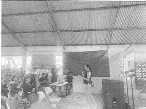
Ilustración 3: Personal de la empresa consultora realizando la explicación del Estudio de Impacto Ambiental del proyecto.