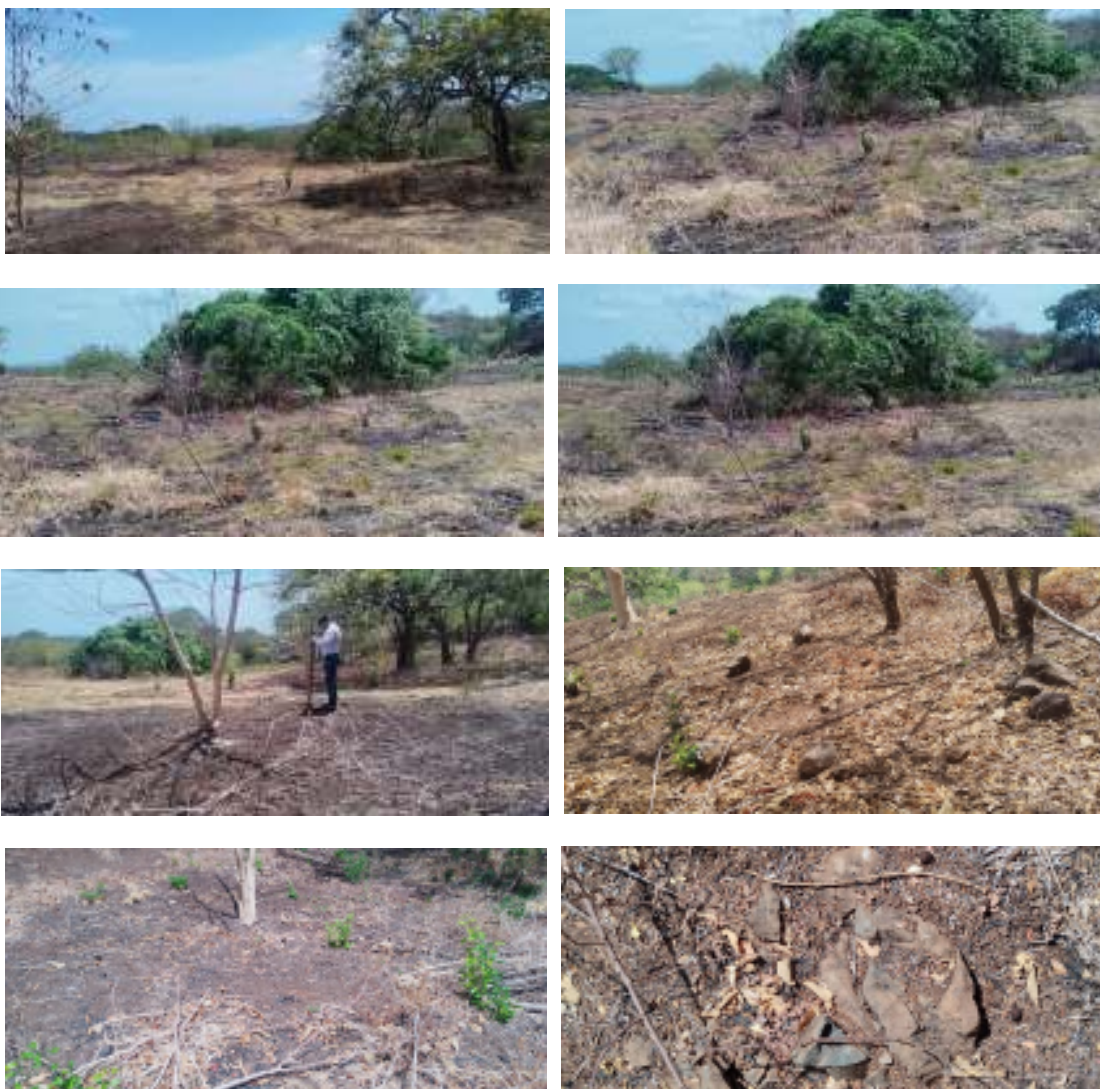
Fotos N° 1, 2, 3, 4, 5, 6, 7, 8: Vista general. Tramo prospectado. alterado por actividad antrópica, afloramiento rocoso en algunas partes y la vegetación del lugar predominan herbazales, rastrojo y gramínea y muy pocos arbustos. Aplicación de sondeo.

Durante el recorrido de los 410 metros lineales en los sitios donde se desarrolló esta prospección, se pudo constatar que, alterado por el paso de vehículos, sin servidumbre y sin cuneta. la construcción del camino de tierra en área rural. La vegetación se caracteriza de herbazales, gramíneas y pocos arbustos. Se utilizaron zonas propicias para la aplicación de sondeos. No hubo hallazgos históricos ni culturales a nivel superficial ni al subsuperficial.