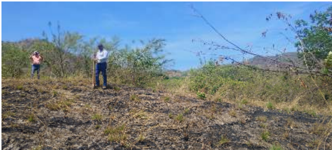
Fotos N° 9, 10, 11 y 12: Vista general. Tramo prospectado, alterado por actividades antrópicas, La vegetación del lugar predominan herbazales, rastrojo y gramínea y pocos arbustos. Aplicación de sondeo.