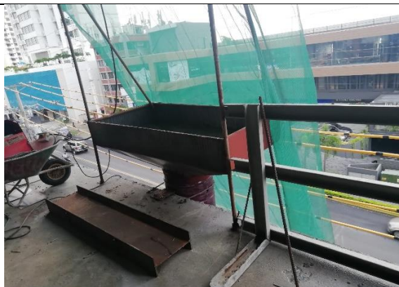
Foto 2 Chuta para disposición de desechos