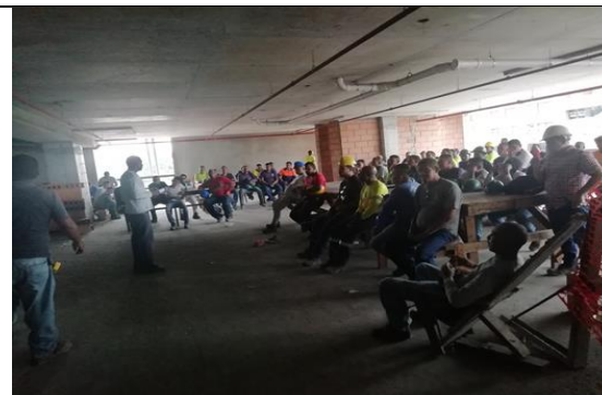
Foto 6 Charlas de seguridad al personal