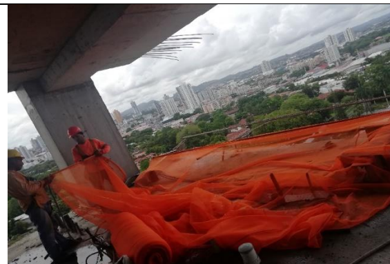
Foto 3 Se colocan bayas para protección de escombros