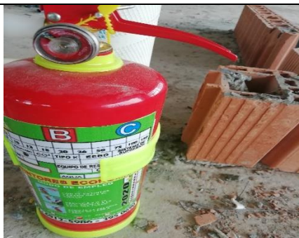
Foto 5 Verificación de los extintores ubicados en sitios estratégicos