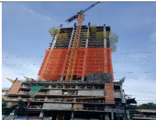
Foto 1 Avance del Proyecto.

A continuación, se presenta el reporte fotográfico que evidencia las medidas aplicadas y las recomendaciones emitidas durante este periodo.