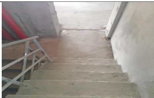
Foto 4 Limpieza de escaleras y lugares para tránsito de personas y vehículos