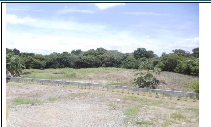
Estado inicial del sitio de proyecto y zonas circundantes.