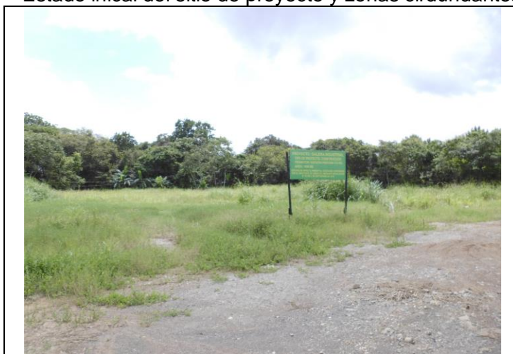
Estado actual de sitio de proyecto,

Las obras para esta fase de planificación se centraron en continuar la ejecución de los planes de aspectos financieros y de asesoramiento de procesos ambientales.