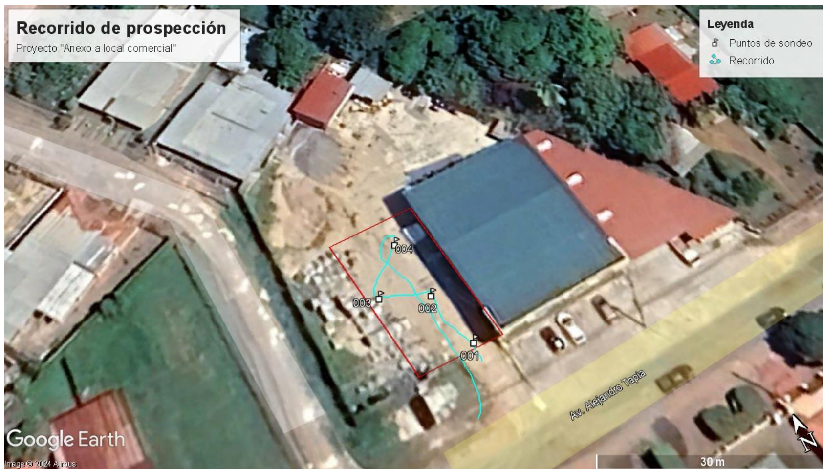
Mapa 3: Recorrido de prospección