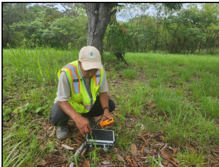
Sitio # 1: DENTRO DEL ÁREA DEL PROYECTO.