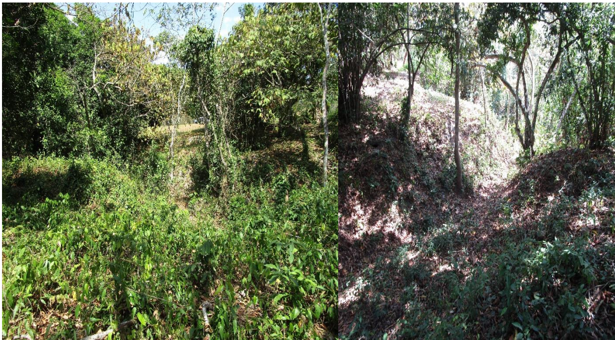
FOTOS 2.-3 VISTA DEL TERRENO DONDE SE DESARROLLARÁ EL PROYECTO.