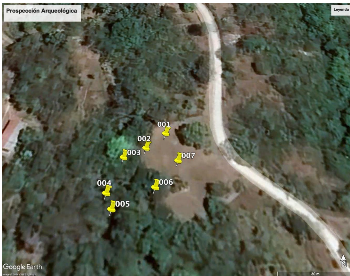
Figura 3-Mapa de Prospecciones