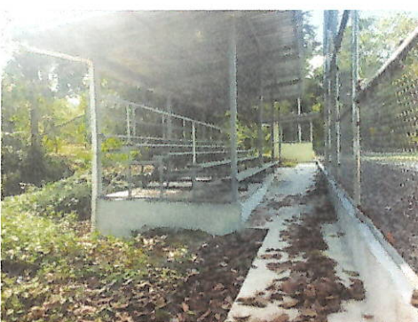
Fotos N° 7, 8, 9, 10, 11, 12, 13 y 14: Vista general, tramo prospectado, alterado por construcciones modernas y senderos. Vegetación predominante entre gramíneas, herbazales y rastrojo y algunos árboles en los alrededores. Se encontró una quebrada o río en la zona. Aplicación de sondeo.