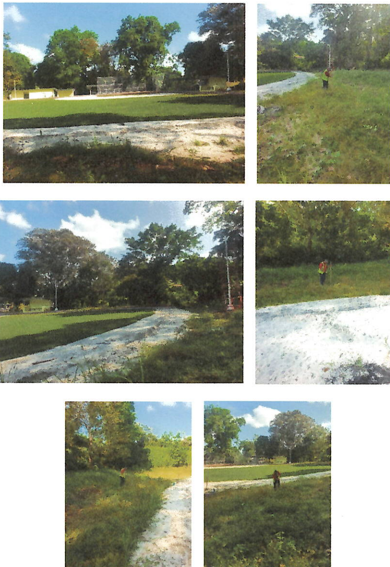
Fotos N°1, 2, 3, 4, 5 y 6: Vista general. Tramo prospectado. Terreno plano alterado por construcciones modernas y senderos de capa asfáltica. Aplicación de sondeo. La vegetación predominante es gramíneas, herbazales y rastrojo.

Durante el desarrollo de la prospección de los 7,168 m 2 de superficie del terreno se comprobó que está alterado debido a la infraestructura moderna existente dado que en el área del proyecto se realizan actividades deportivas y de recreación con senderos y caminos de concreto e infraestructura para la práctica de deportes. La vegetación predominante es gramíneas, herbazales y rastrojo con algunos árboles y arbustos en los perímetros circundantes y cerros colindantes. Se ubicaron las zonas propicias para la realización de los pozos de sondeo, aunque no se lograron hallazgos a nivel superficial ni subsuperficial.