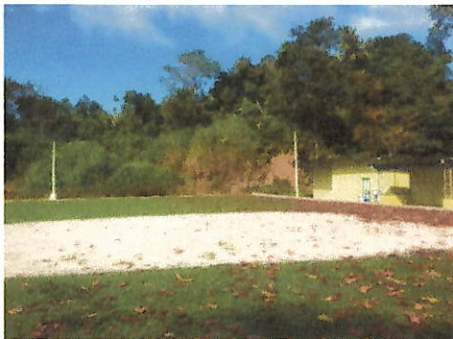
Fotos N° 15, 16, 17, 18, 19, 20 y 21: Vista general, tramo prospectado, terreno plano alterado por construcciones modernas y senderos. Colindante con cerro alterado por corte. Vegetación principalmente compuesta de gramíneas, herbazales y rastrojo, notando que los árboles y arbustos se encuentran en el cerro colindante.