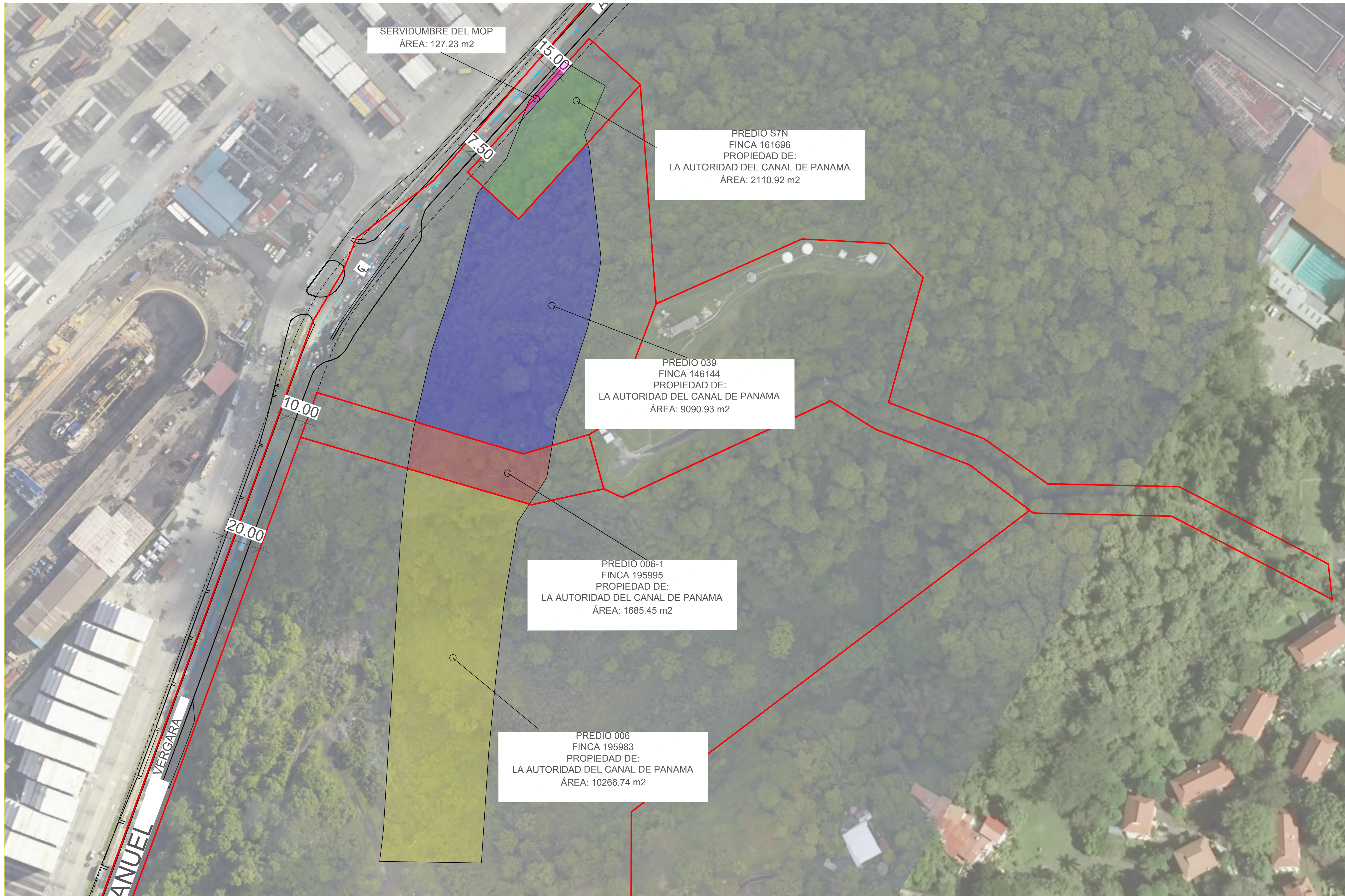
1 PLANTA DE DESGLOSE DE AREAS POR DUEÑO -POLIGONO EIA CERRO SOSA 1/1000