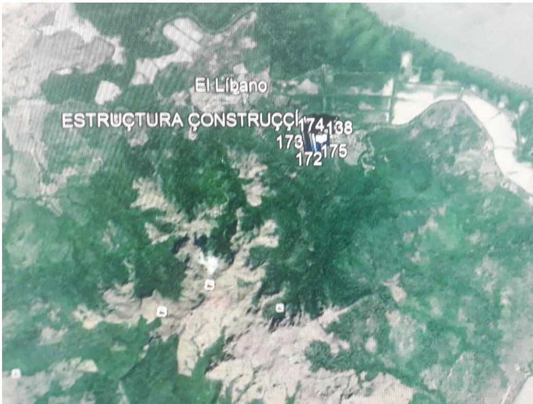
Vistas satelitales A y B. Prospección arqueológica del polígono