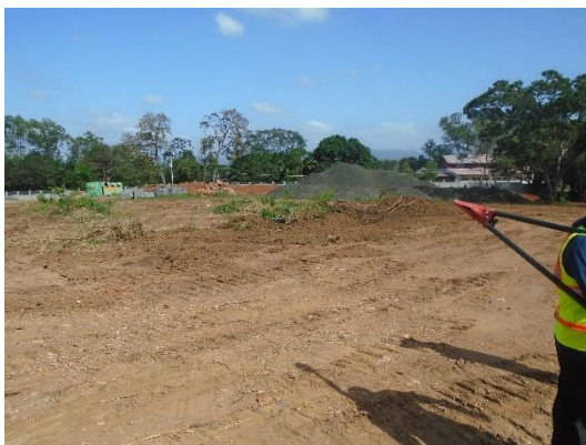
Fotos No. 4, 5, y 6 Tramos prospectados del lote