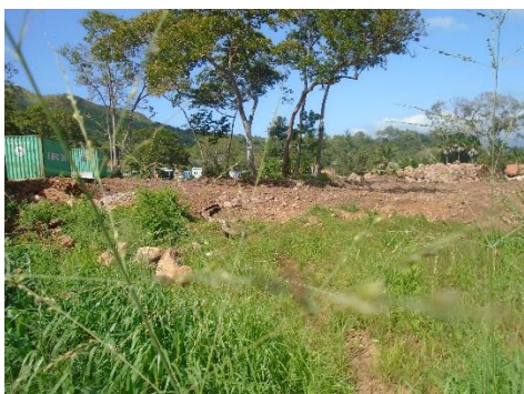
Fotos No.26, 27, y 28 Contorno del proyecto en estudio