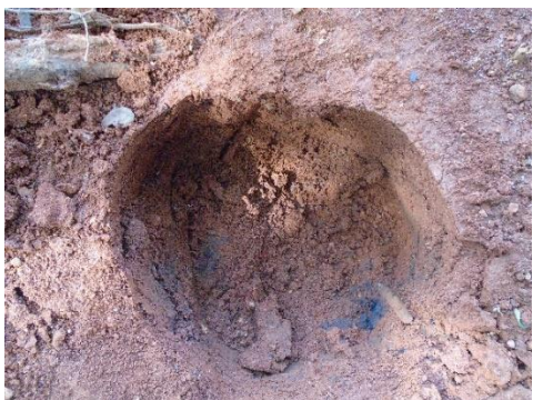
Fotos No. 16, 17, 18, y 19 Prospección en lote