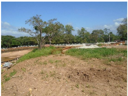
Fotos No. 29 y 30 Contorno del proyecto en estudio