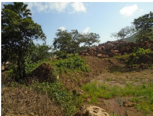
Fotos No. 1, 2, y 3 Tramos prospectados del lote