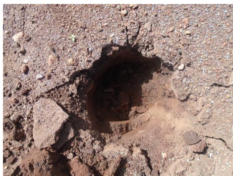
Foto No. 19 Sondeo