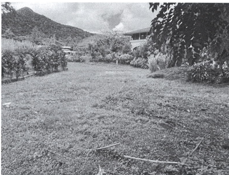
Fig. 6: área propuesta para la PTAR.