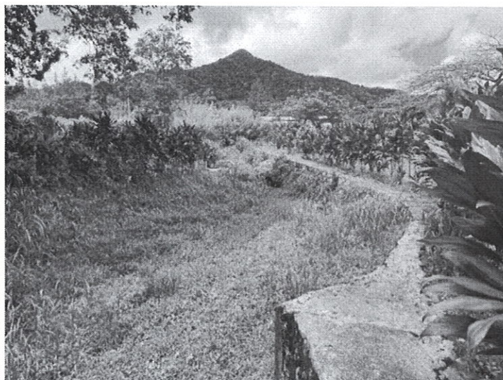
Fig. 7 y 8: quebrada La Honda.