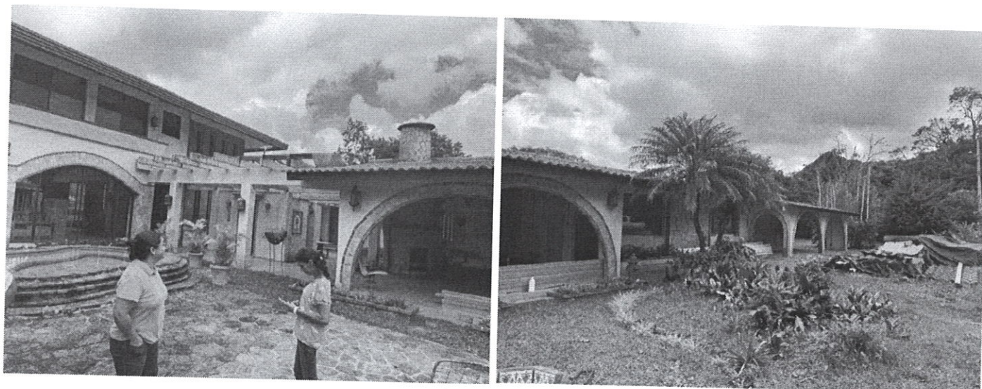
Fig. 1 y 2: casa existente, la cual será remodelada.