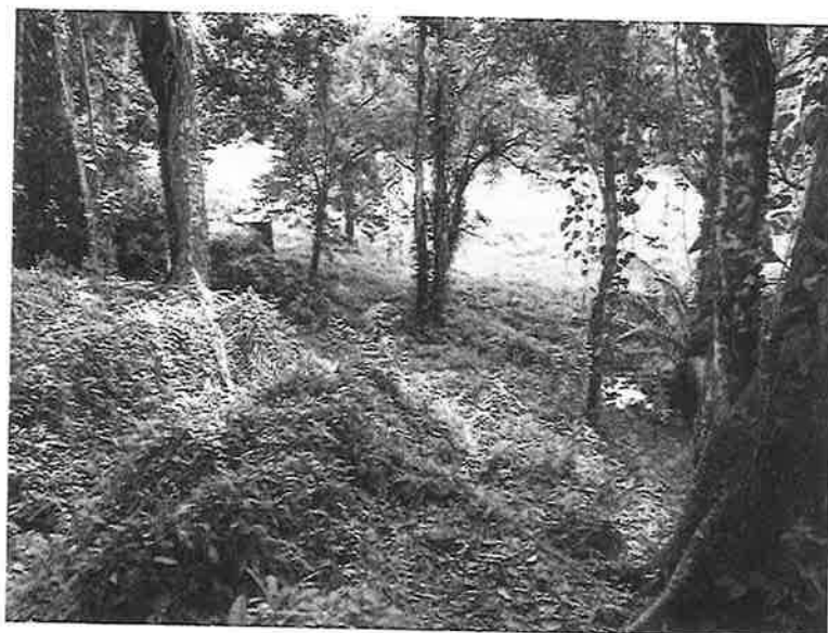
ÁREA DE POZOS