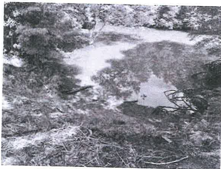
VISTAS DEL RÍO SALAO