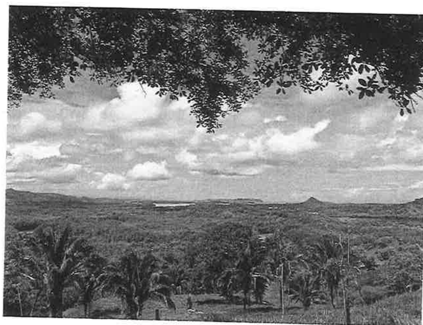
BELLEZA ESCENICA DEL SITIO

EXPEDIENTE U/A 757 UNIDAD AMBIENTAL – ARAP PROYECTO: HACIENDA COROTU PROMOTOR: HACIENDA COROTU, S.A. FECHA DE ELABORACIÓN: 18 DE JUNIO DE 2024.