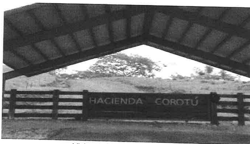
Visita a el area del proyecto.