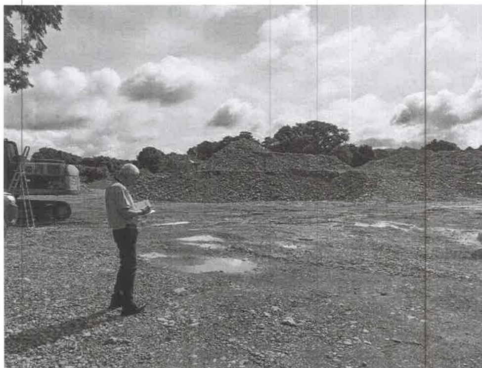
EQUIPO TECNICO EN EL AREA DEL PROYECTO