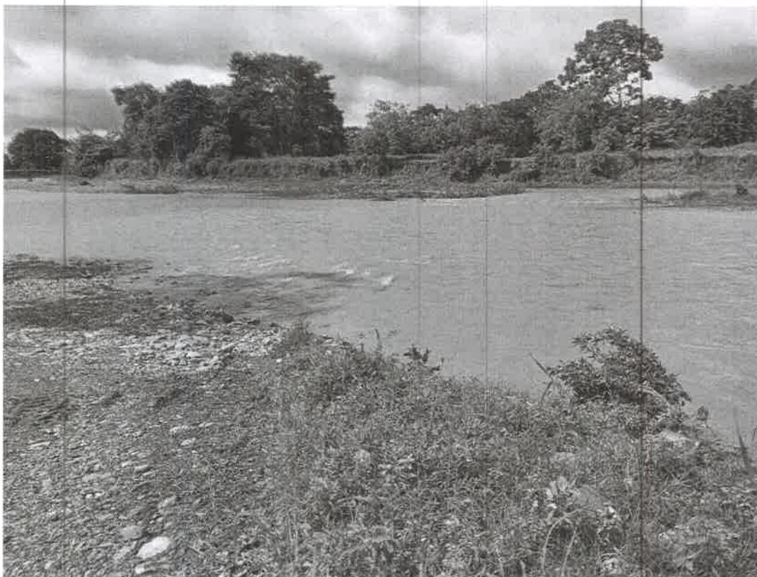
VISTAS DEL RIO SAN FÉLIX PARTE DEL ÁREA DE EXTRACCIÓN DE GRAVA.