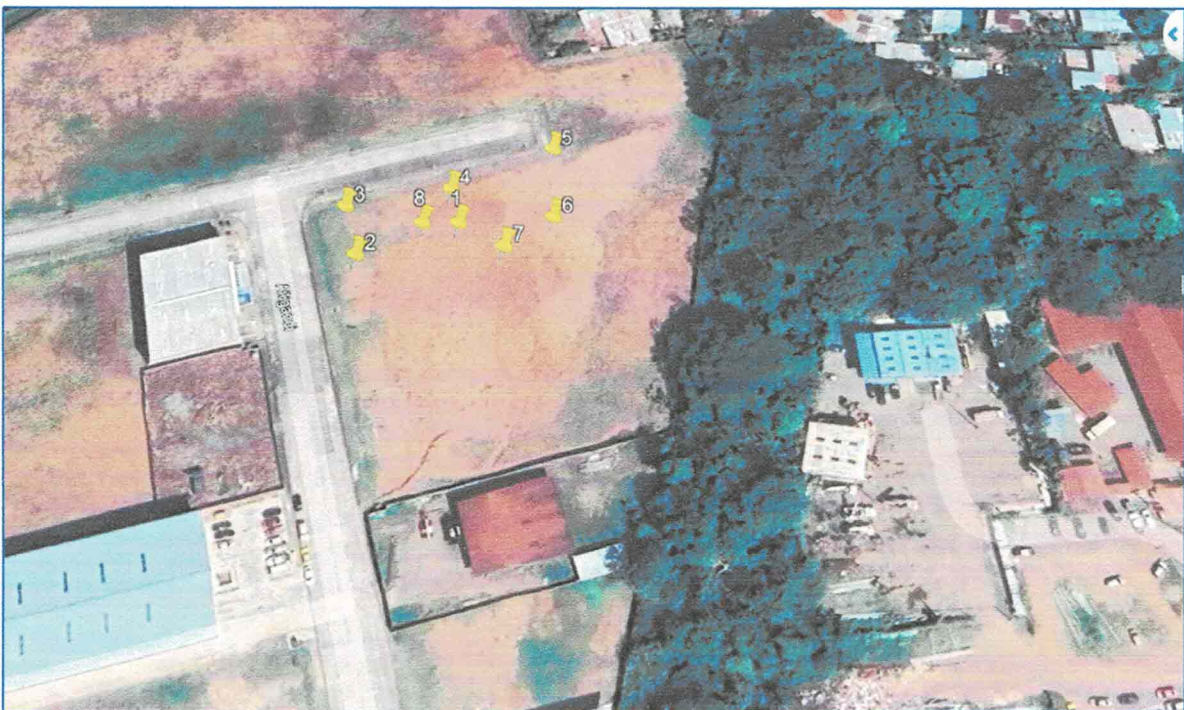
Vista Satelital No. 2. Proyecto "TOCUMEN PARK 11".