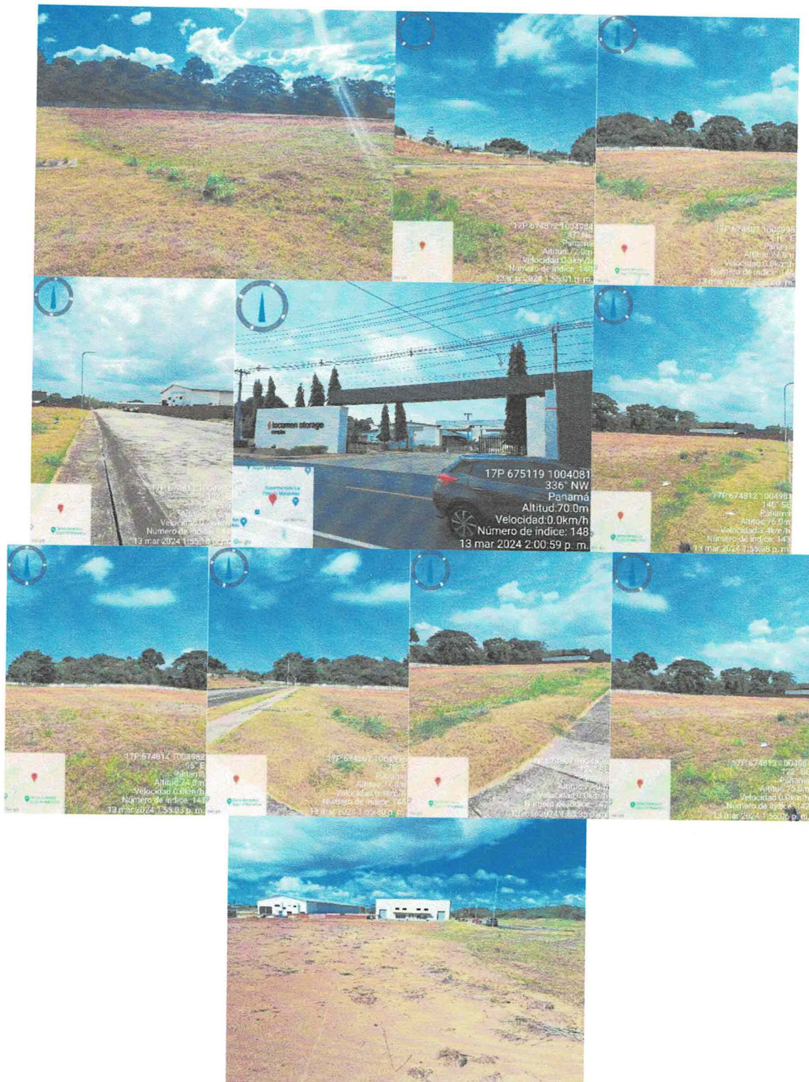
Fotos N°1, 2, 3, 4, 5, 6, 7, 8, 9, 10 y 11: Vista general. Tramo prospectado. Terreno ubicado en una zona rural plana con tierra, césped y bodegas habitadas. Rodeado de vegetación densa y árboles frondosos, colinda con una carretera principal y edificaciones modernas. Cercado por una cerca artificial.