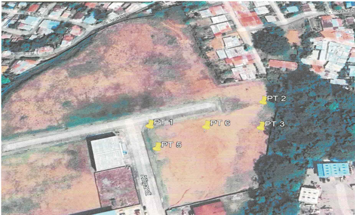
Vista Satelital No. 1. Proyecto "TOCUMEN PARK 11".