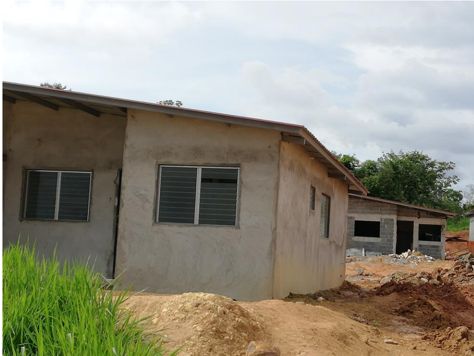
AVANCES DE OBRAS