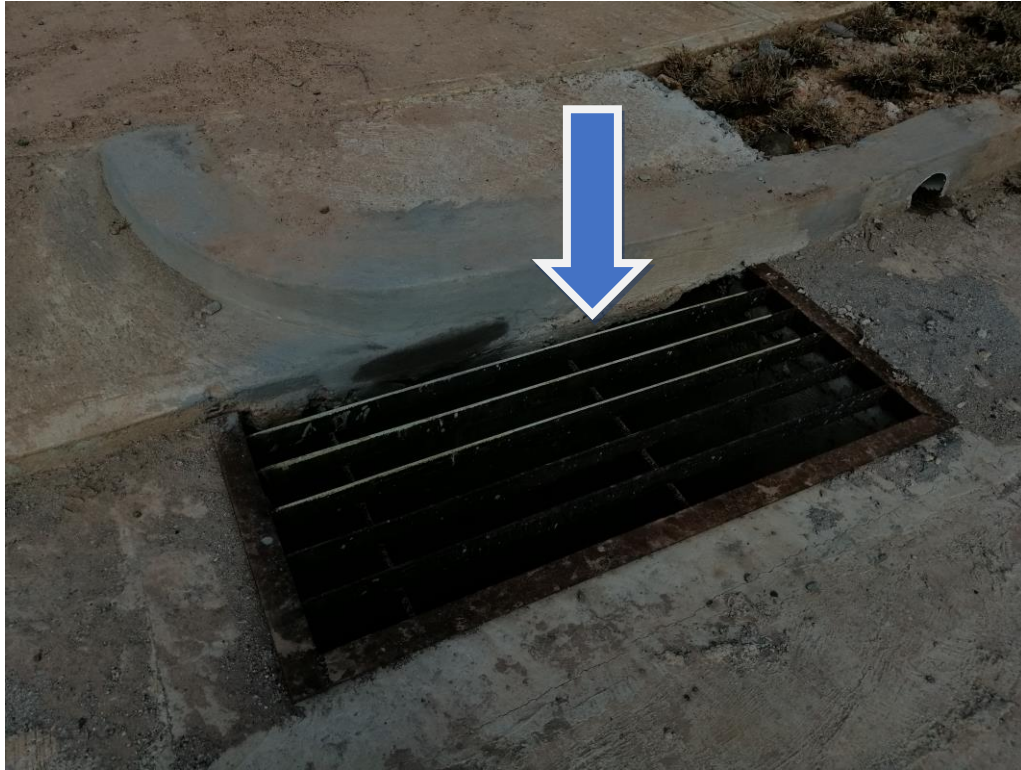
TRAGANTES DE AGUAS PLUVIALES Y GRAMA INSTALADA