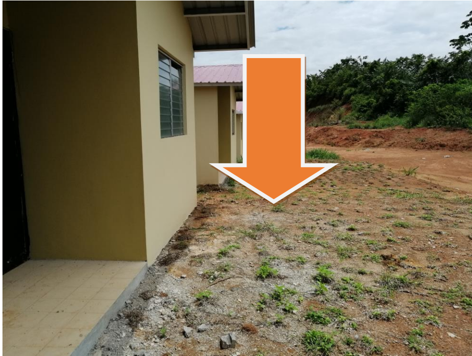
Casas terminadas y grama instalada.