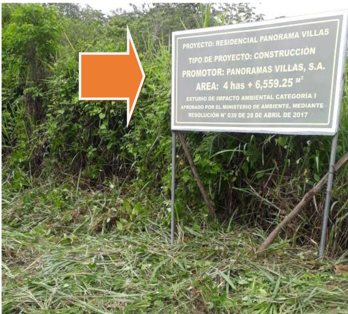
Letrero instalado y planta de tratamiento