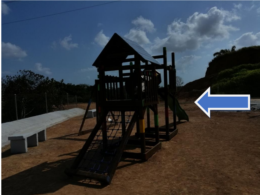
PARQUE INFANTIL ENGRAMAMAMIENTO EN PARTES DE ATRÁS DE LAS CASAS