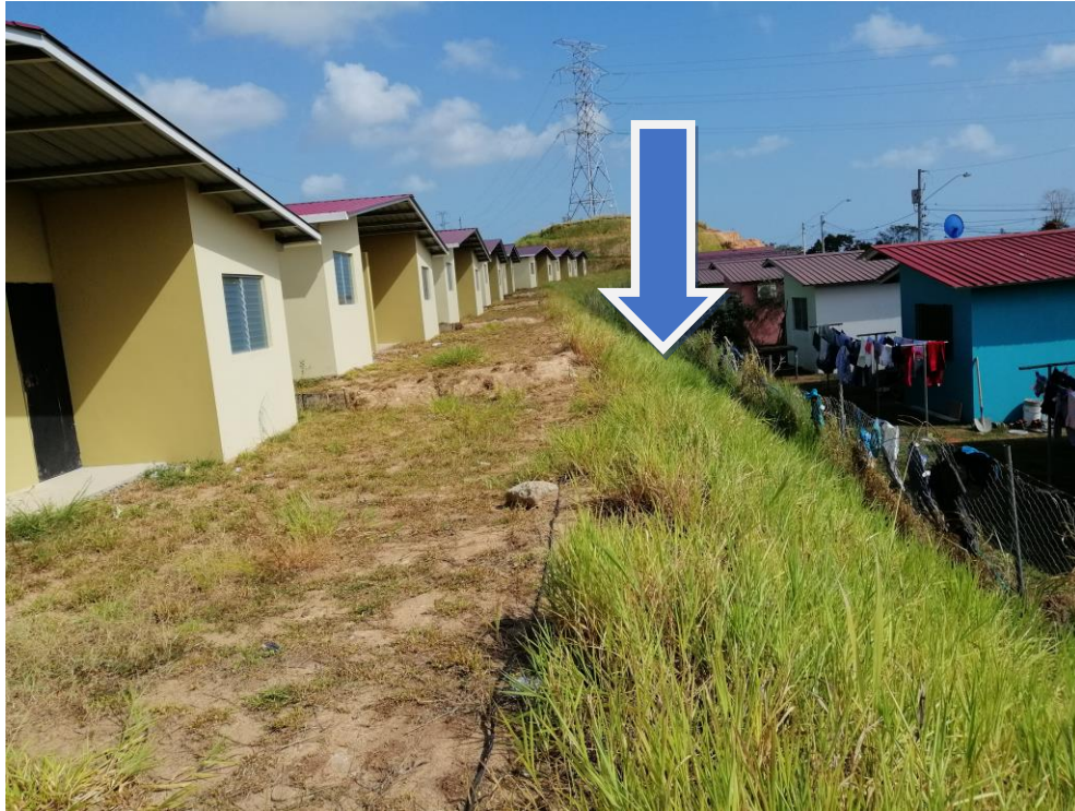
GRAMA INSTALADA EN TALUDES Y DETRÁS DE LAS CASAS