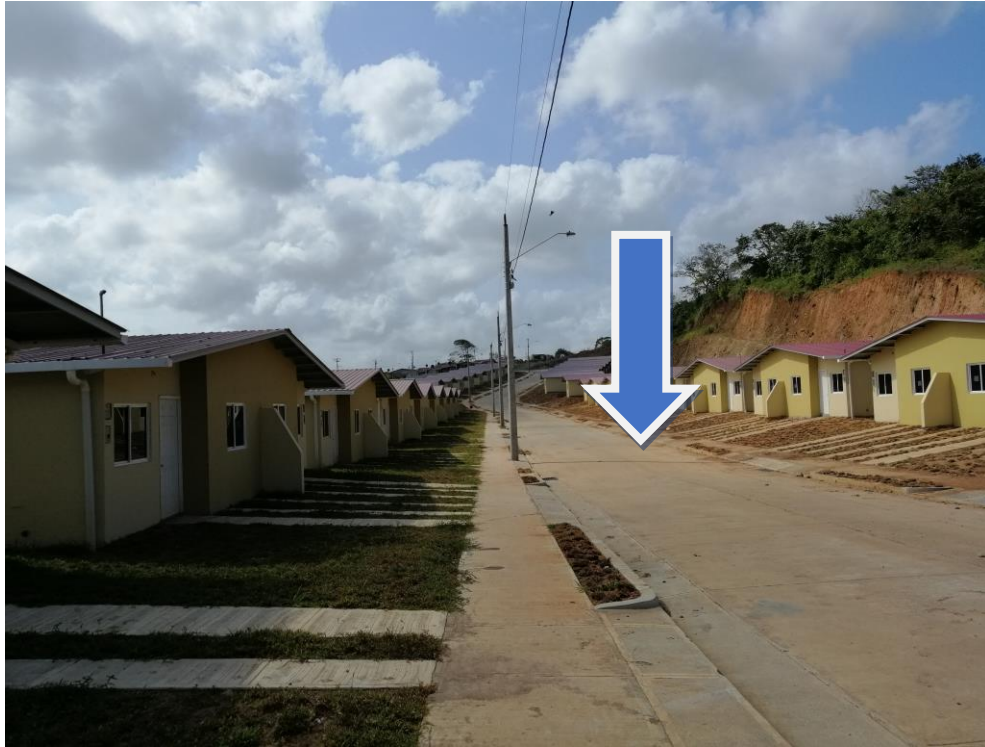
CALLES LIMPIAS Y AREAS TERMINADAS