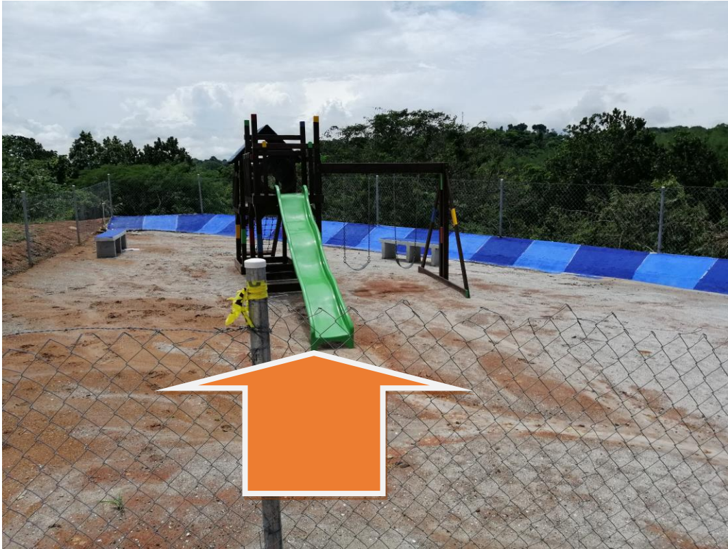
Parque o área de uso público 100% y tragante con su respectiva rejilla