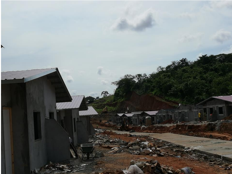
AVANCES DE OBRAS