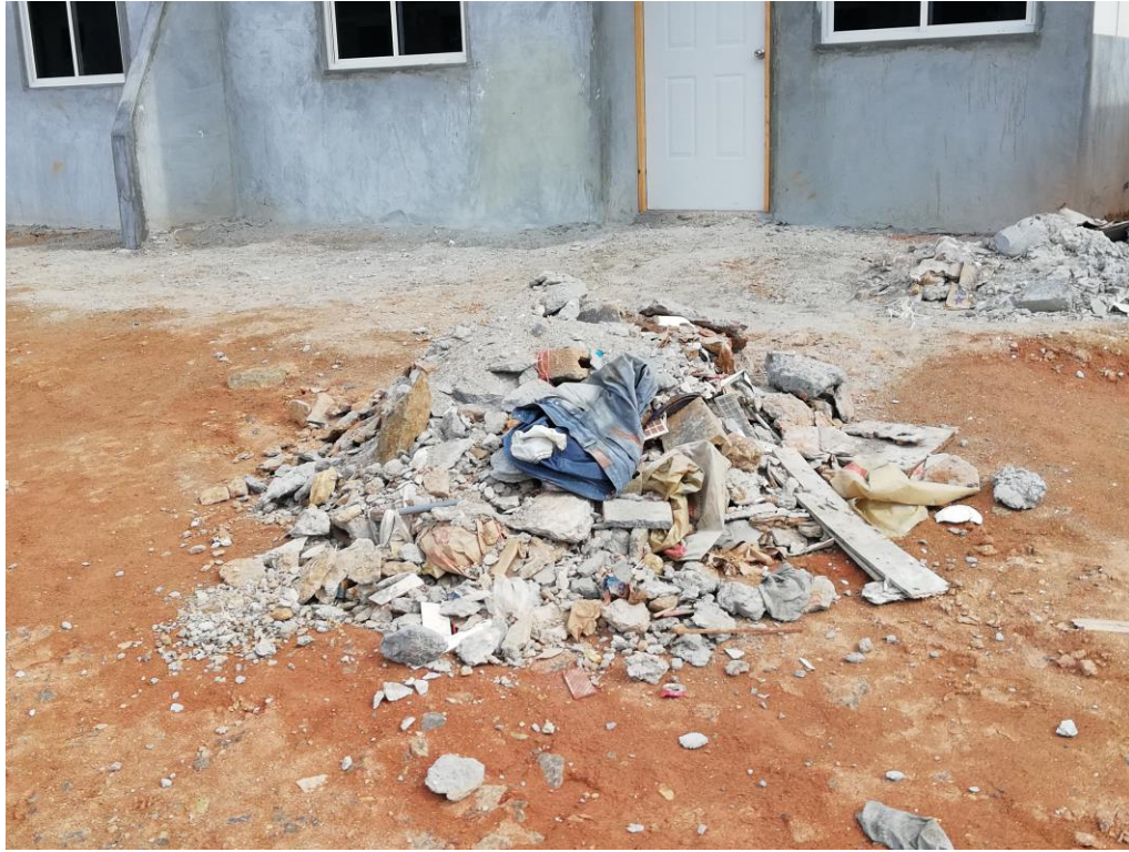
ACUMULACION DE DESECHOS SOLIDOS PARA LUEGO SER LLEVADOS AL RELLENO SANITARIO Y REVEGETACION EN TALUDES