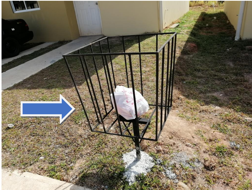
CESTO PARA DEPOSITAR BASURA Y ENGRAMAMIENTO EN LATERARES