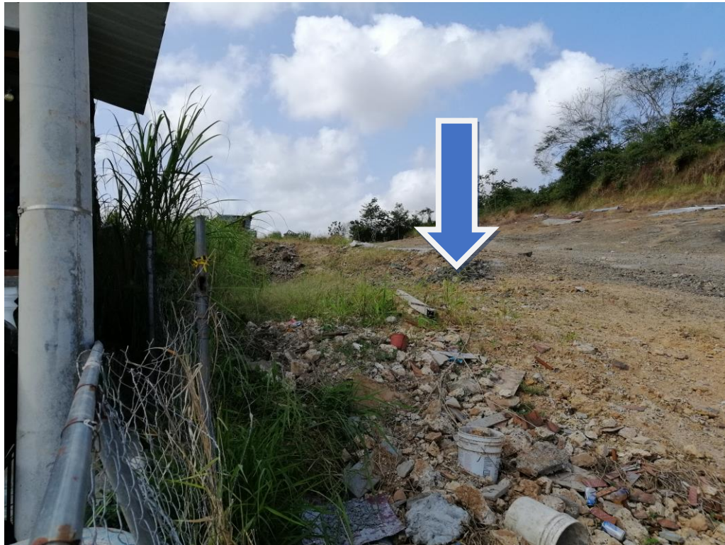
AREA TEMPORAL DE DESECHOS