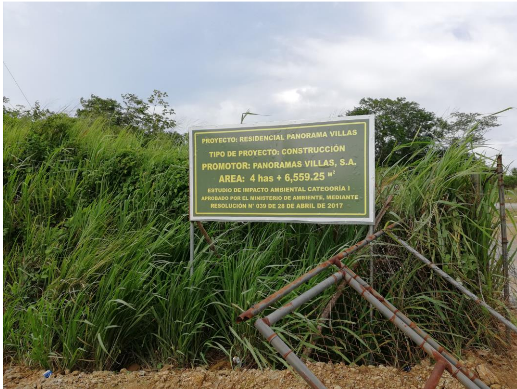
LETRERO EN CUMPLIMIENTO A LA RESOLUCION Y VALLA INFORMATIVA