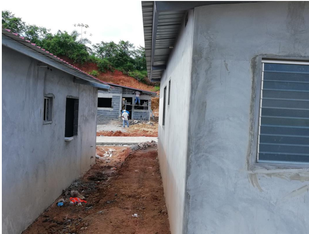
AVANCES DE OBRAS