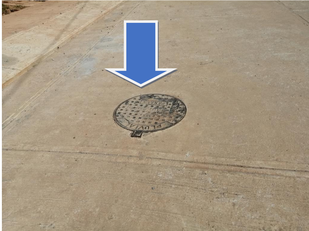
SISTEMA DE ALCANATRILLADO Y TRAGANTE DE AGUA PLUVIALES