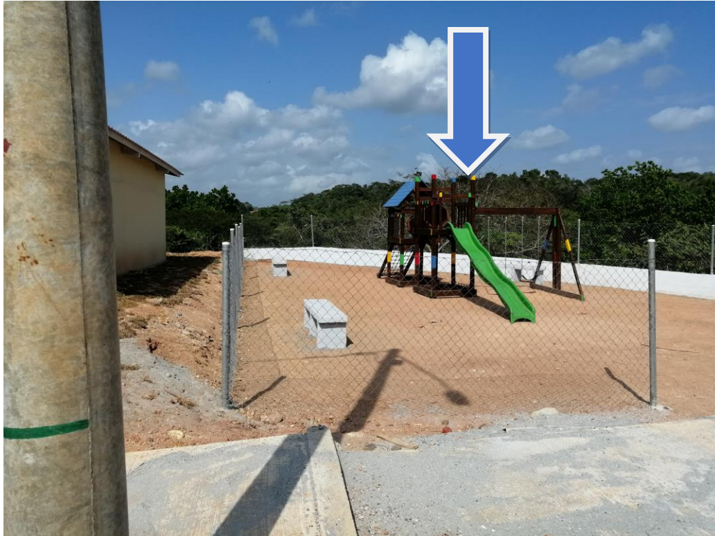
AREA SOCIAL CASAS TERMINAS Y ENGRAMADAS