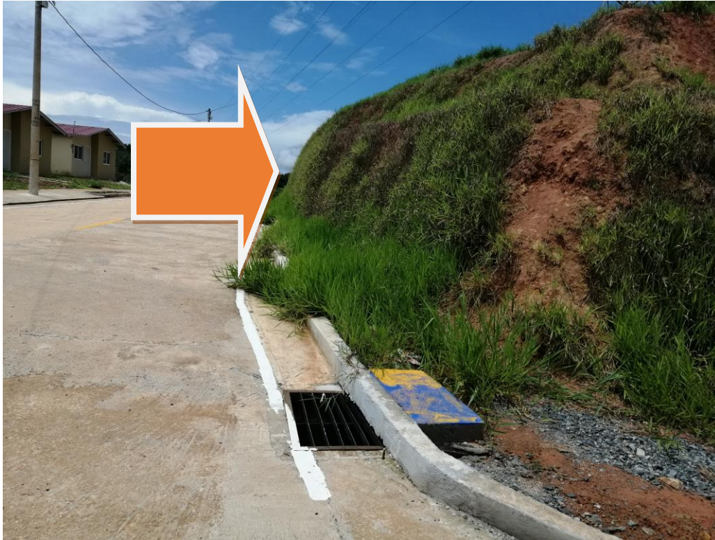
Taludes revestidos y casas terminadas, pero no en operación.