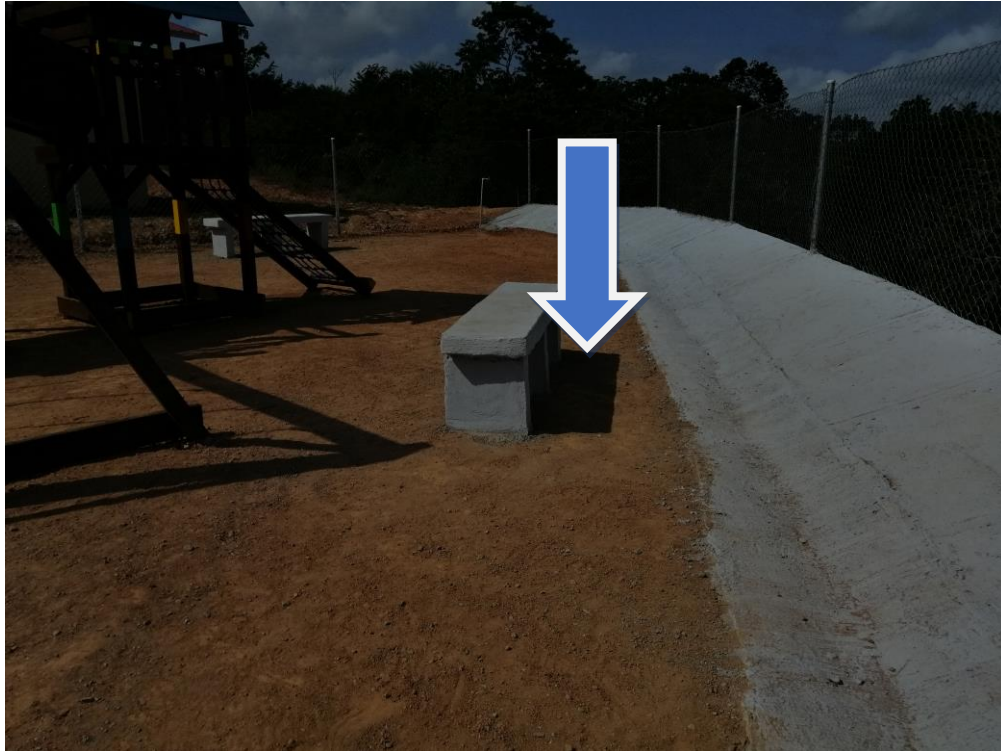
AREA SOCIAL Y PROTECCION DE TORRE