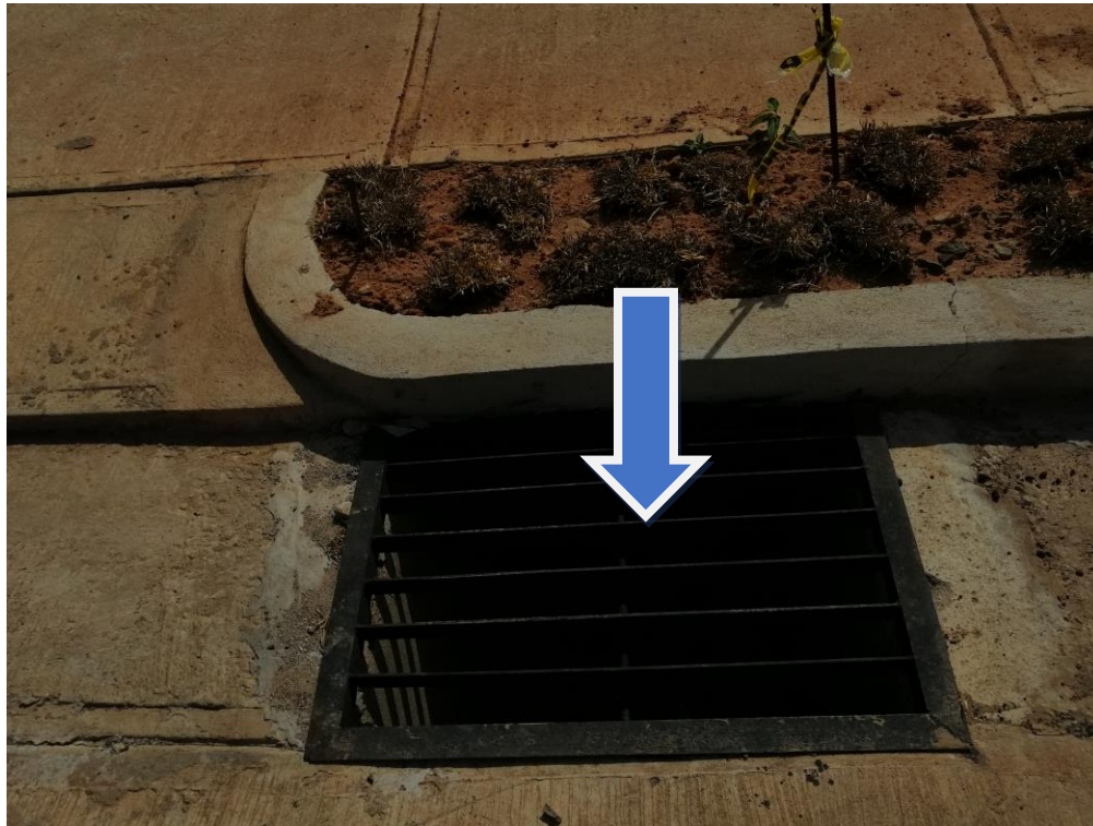
TRAGANTES DE AGUAS PLUVIALES Y CASAS TERMINADAS