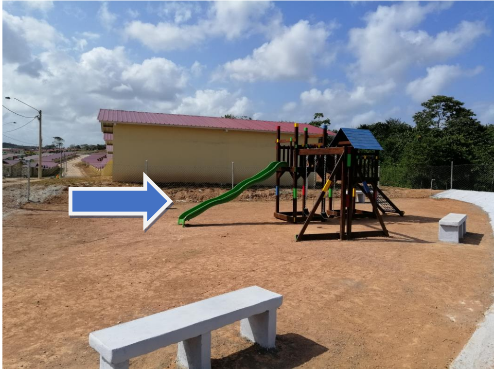
AREA SOCIAL Y CERCA DE PROTECCION