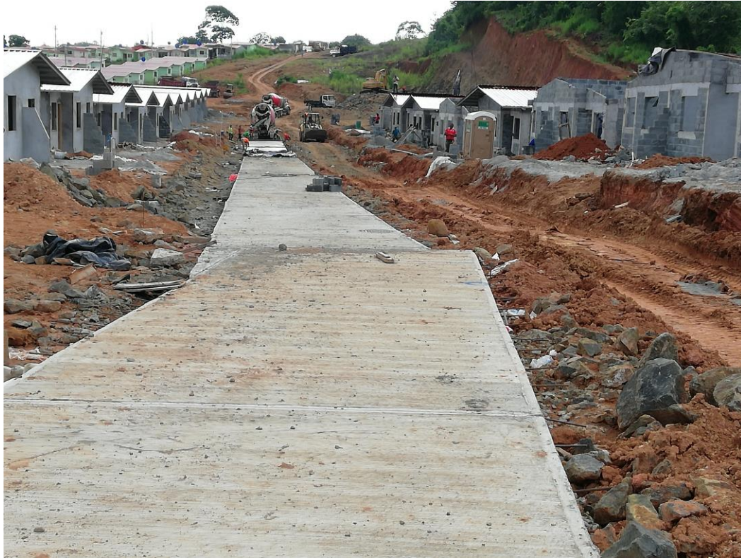
AVANCES DE CALLES GRIFO DE AGUA POTABLE