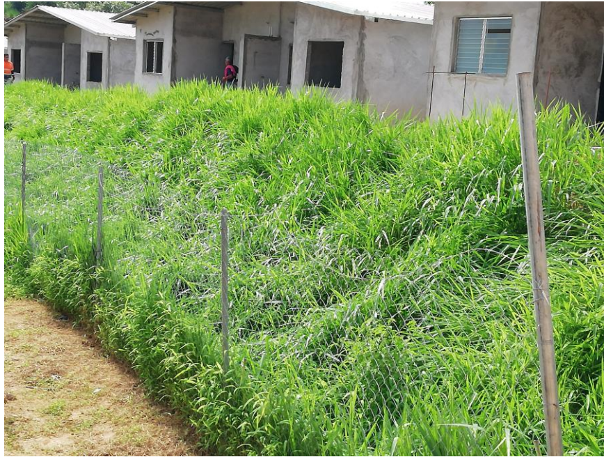
MEDIDAS CONTRA LA EROSION