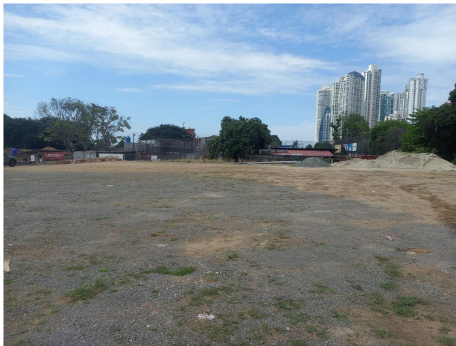
Área de construcción del proyecto Coordenadas Datum WGS 84 0664216E ;0993747N