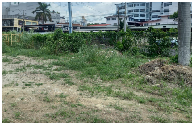
Área de construcción del proyecto Coordenadas Datum WGS 84 0664216E ;0993747N