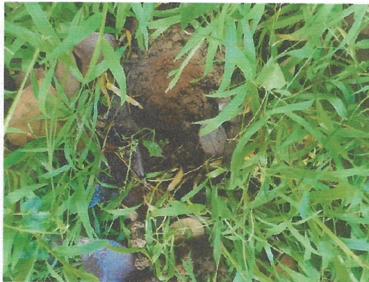
FOTO DEL SONDEO