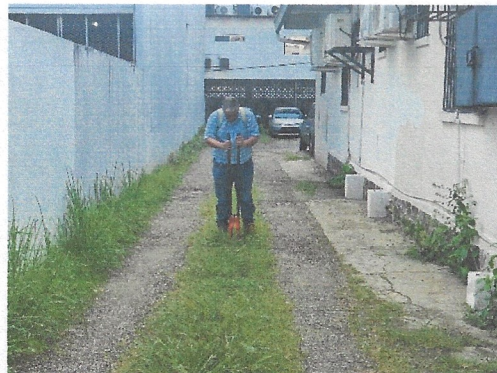
Fotos N°1, 2, 3, 4, 5, 6 y 7: Vista general. Tramo prospectado. Terreno plano alterado por construcciones modernas. Aplicación de sondeo.