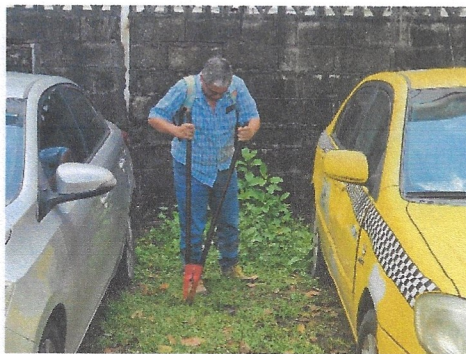
Fotos N° 8, 9, 10, 11, 12, 13 y 14: Vista general, tramo prospectado, alterado por construcciones modernas. Aplicación de sondeo.