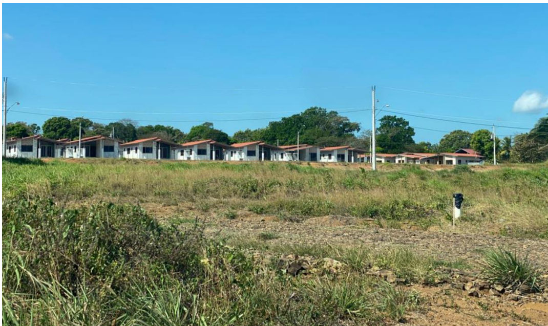
Ilustración 9. Vista del terreno a desarrollar

Los terrenos del promotor, y las fincas vecinas no escapan de esta realidad; el polígono en donde se ha delimitado la residencial, tiene puntos con elevaciones bajas. El terreno a desarrollar podría describirse como una planicie que favorece las intenciones del desarrollo.