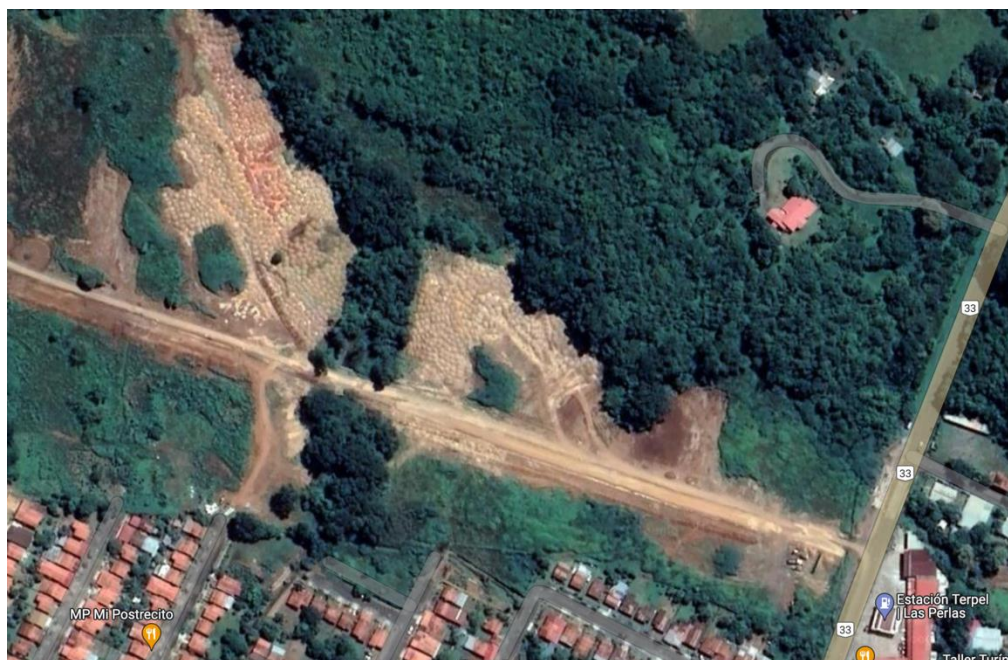
Ilustración 2. Vista del terreno a desarrollar, el cual ya fue intervenido para la construcción de las colectoras sanitarias del nuevo alcantarillado de la Ciudad de Santiago.

El área, es propiamente lo que se conoce como una comunidad urbana, en donde se observan gran cantidad de viviendas unifamiliares, intercaladas con pequeñas industrias y comercios propios de centros de la periferia urbana.