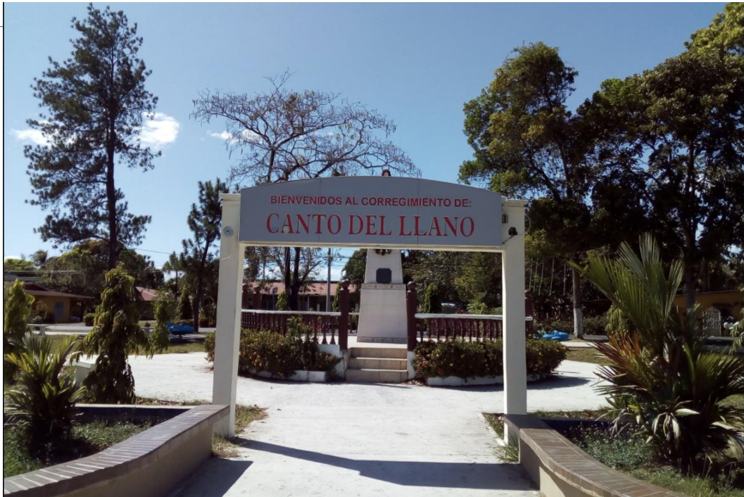
Ilustración No. 3. Vista del parque de la zona