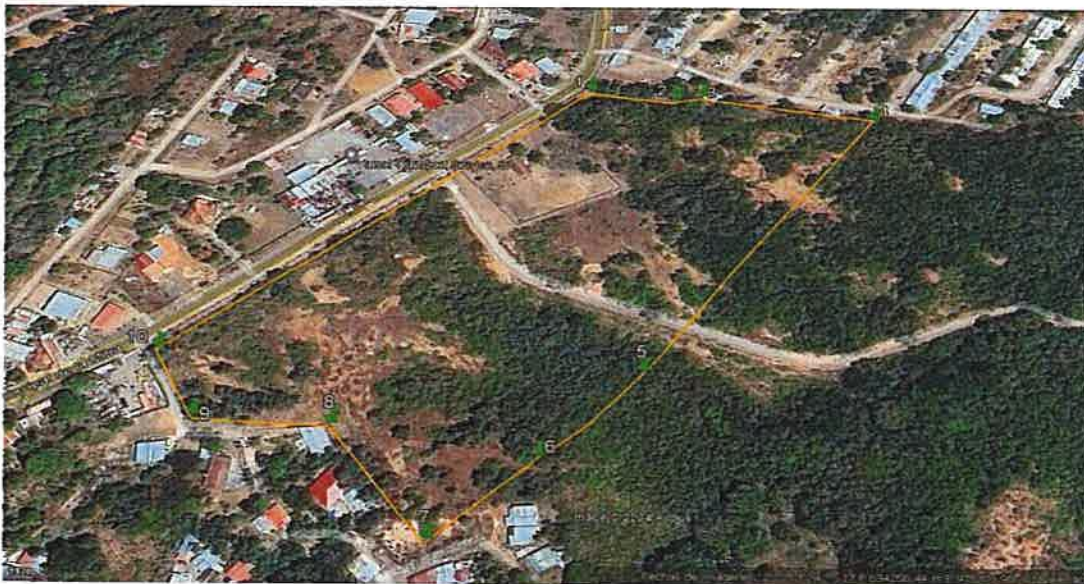
Cuadro No.1: COORDENADAS DATUM WGS 84