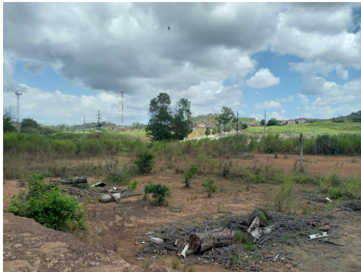
Dentro área el proyecto