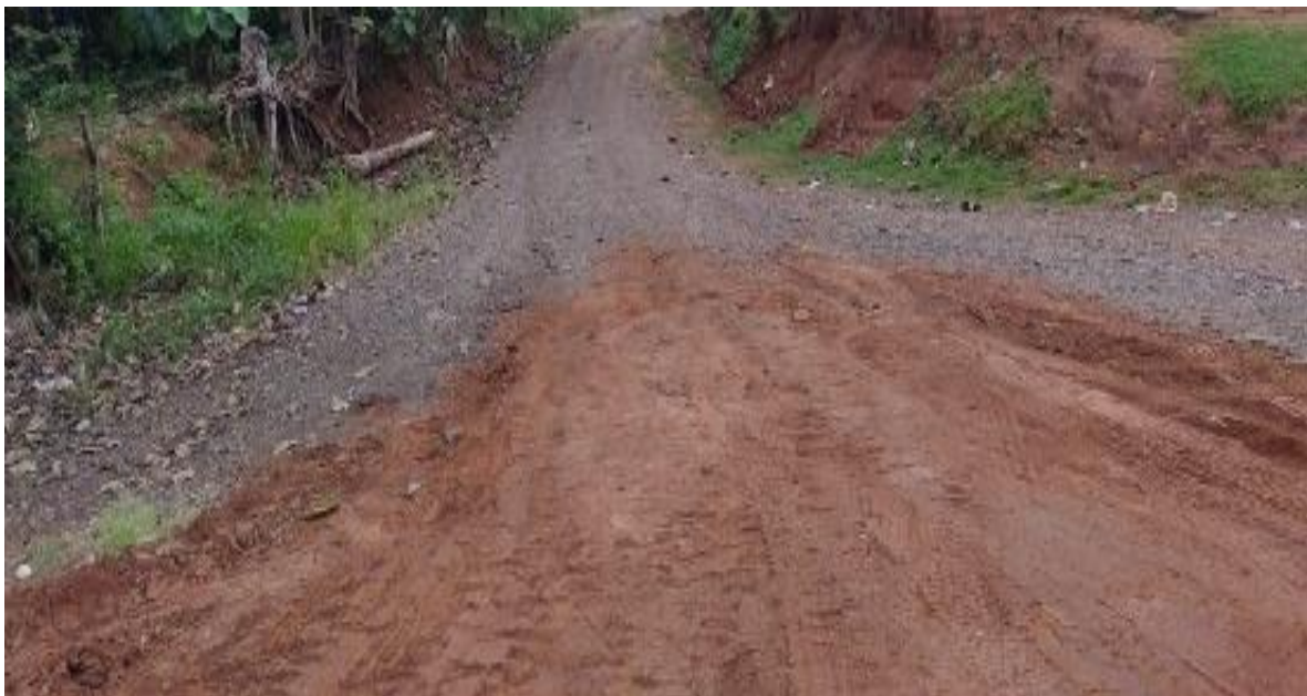
Terrenos en el área de proyecto.

Las capas mostraron un nivel de tierra marrón arcillo-arenoso-rojiza, precedido por una delgada capa húmica café oscuro. No se observó en superficie, ni en los perfiles, material arqueológico.