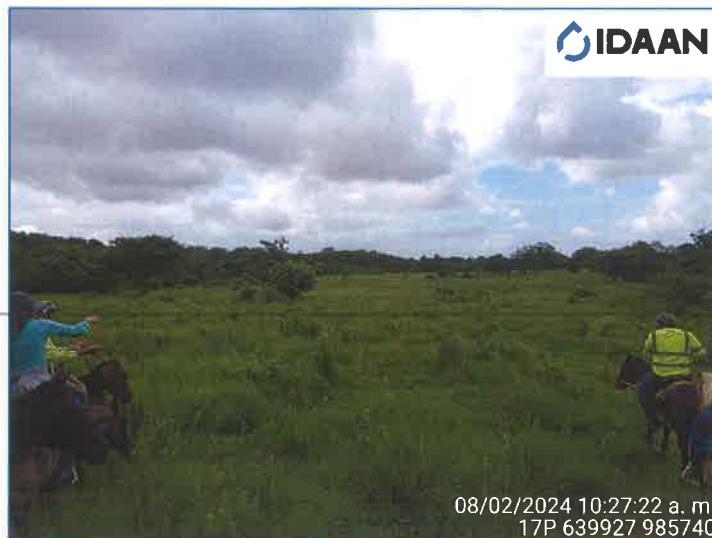
Ilustración 1 Sitio donde se desarrollará el proyecto.