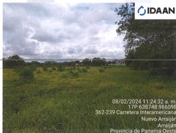
Ilustración 2 Sitio a intervenir para desarrollar el proyecto.