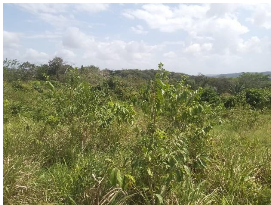
Fotos 1, 2, 3, 4: Vista general. Tramo prospectado, terreno sinuoso con ligeras pendientes, con alta densidad de vegetación predominantemente gramíneas, herbazales y rastrojo y algunos arbustos y árboles.