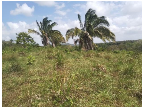
Fotos 13,14,15,16y17: Vista general. Tramo prospectado, terreno sinuoso con ligeras pendientes y plano en algunos sectores. La vegetación predominante es gramíneas, herbazales y rastrojo con algunos árboles y arbustos.