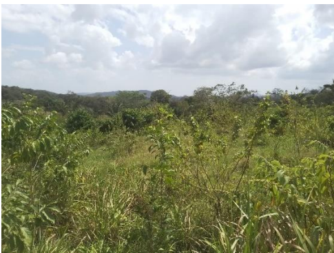
Fotos 5,6,7,8,9,10,11y12: Vista general. Tramo prospectado, terreno sinuoso con algunos sectores planos. La vegetación es abundante, predominan las gramíneas, herbazales y rastrojo con algunos árboles y arbustos.