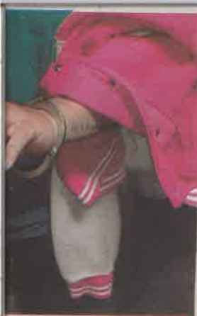
is en la operación Jericó.