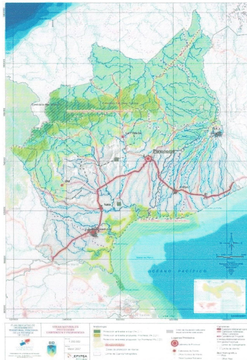
Figura 2: Mapa de Áreas Protegidas