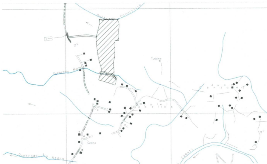
Imagen1 : Mapa de Ubicación del proyecto

Mapa de localización regional del proyecto.