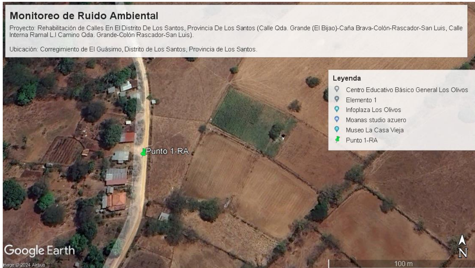
Imagen 1. Localización del monitoreo.