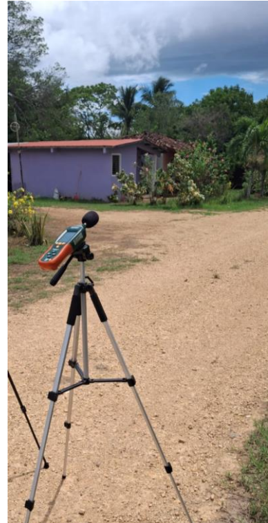
Fotografía 1-2: Frente a entrada residencial.