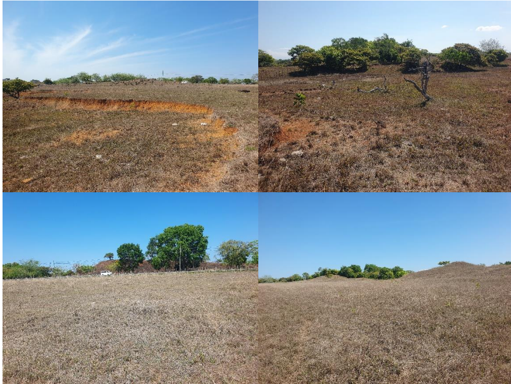
Fotos N° 1, 2, 3, 4, 5, 6, 7, 8, 9,, 10, 11, 12, 13, 14, 15, 16, 17, 18, 19 y 20: Vistas generales. Tramo prospectado. El terreno prospectado en zona rural tiene una topografía plana y ondulada con cubierta de tierra y vegetación mayormente seca. Se encontraron árboles y está delimitado por una cerca artificial.