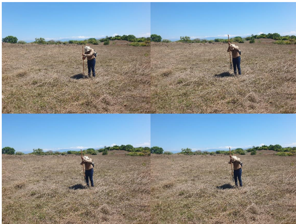
Fotos N° 20, 21, 22, 23, 24, 25, 26, 27 y 28: Vista general, tramos prospectados. Muestra de Sondeo.

El siguiente cuadro muestra las coordenadas tomadas durante la prospección arqueológica: