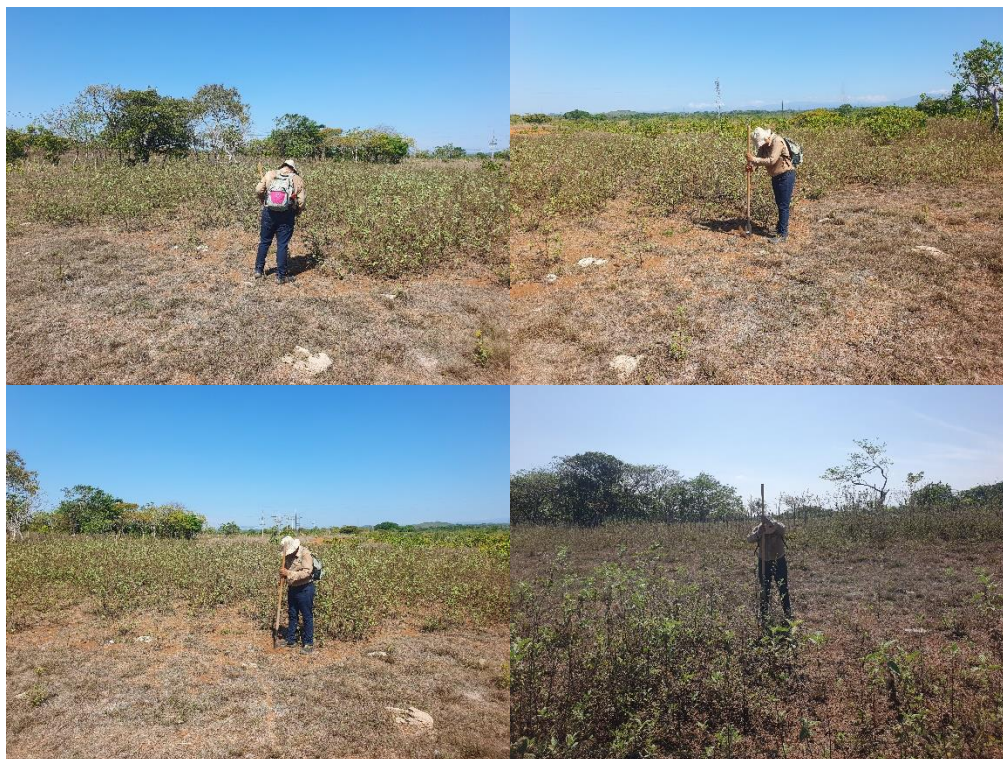
Fotos Nº 20, 21, 22, 23 y 24: Vista general, tramos prospectados.Muestra de Sondeo.

El siguiente cuadro muestra las coordenadas tomadas durante la prospección arqueológica: