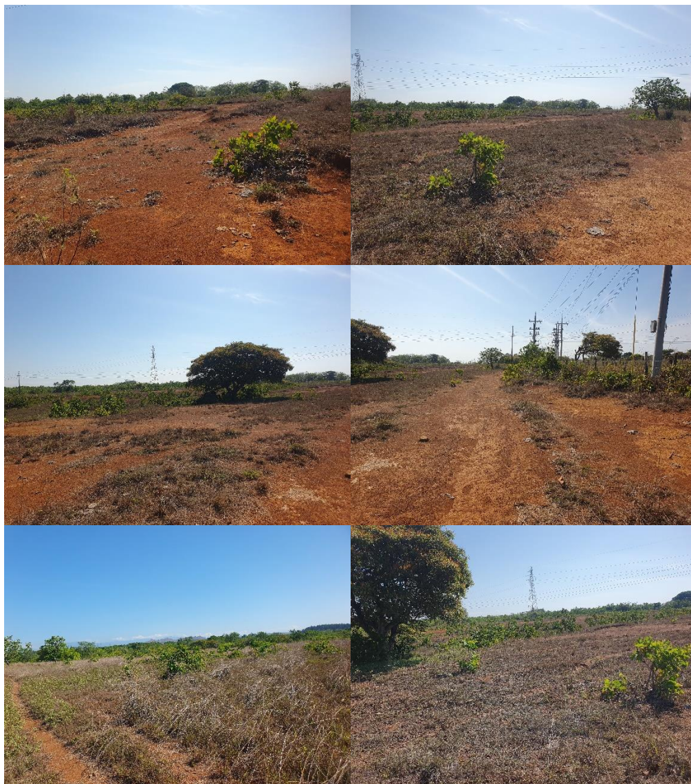
Fotos N° 1, 2, 3, 4, 5, 6, 7, 8, 9,, 10, 11, 12, 13, 14, 15, 16, 17, 18, 19 y 20: Vistas generales. Tramo prospectado. El terreno prospectado en zona rural tiene una topografía plana con cubierta de tierra y vegetación. Se encontraron árboles y postes eléctricos y está delimitado por una cerca artificial.