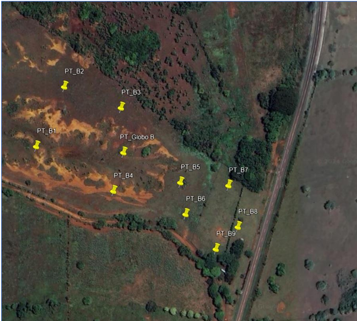
Vista Satelital N° 1. Proyecto “PLANTA FOTOVOLTAICA JAGÜITO GREEN ENERGY II”