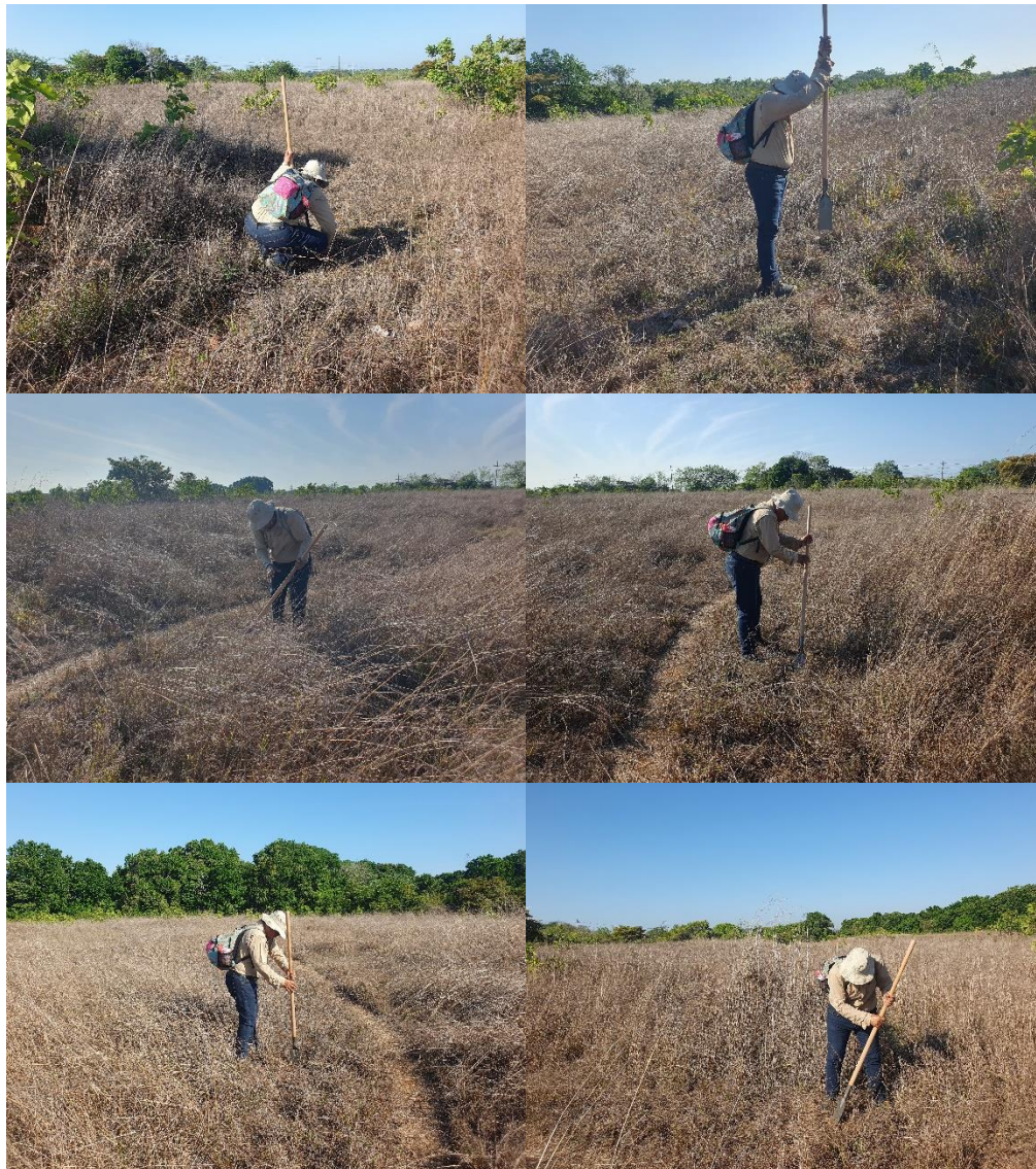
Fotos N° 41, 42, 43, 44, 45 y 46: Vista general, tramos prospectados. Muestra de Sondeo.

El siguiente cuadro muestra las coordenadas tomadas durante la prospección arqueológica: