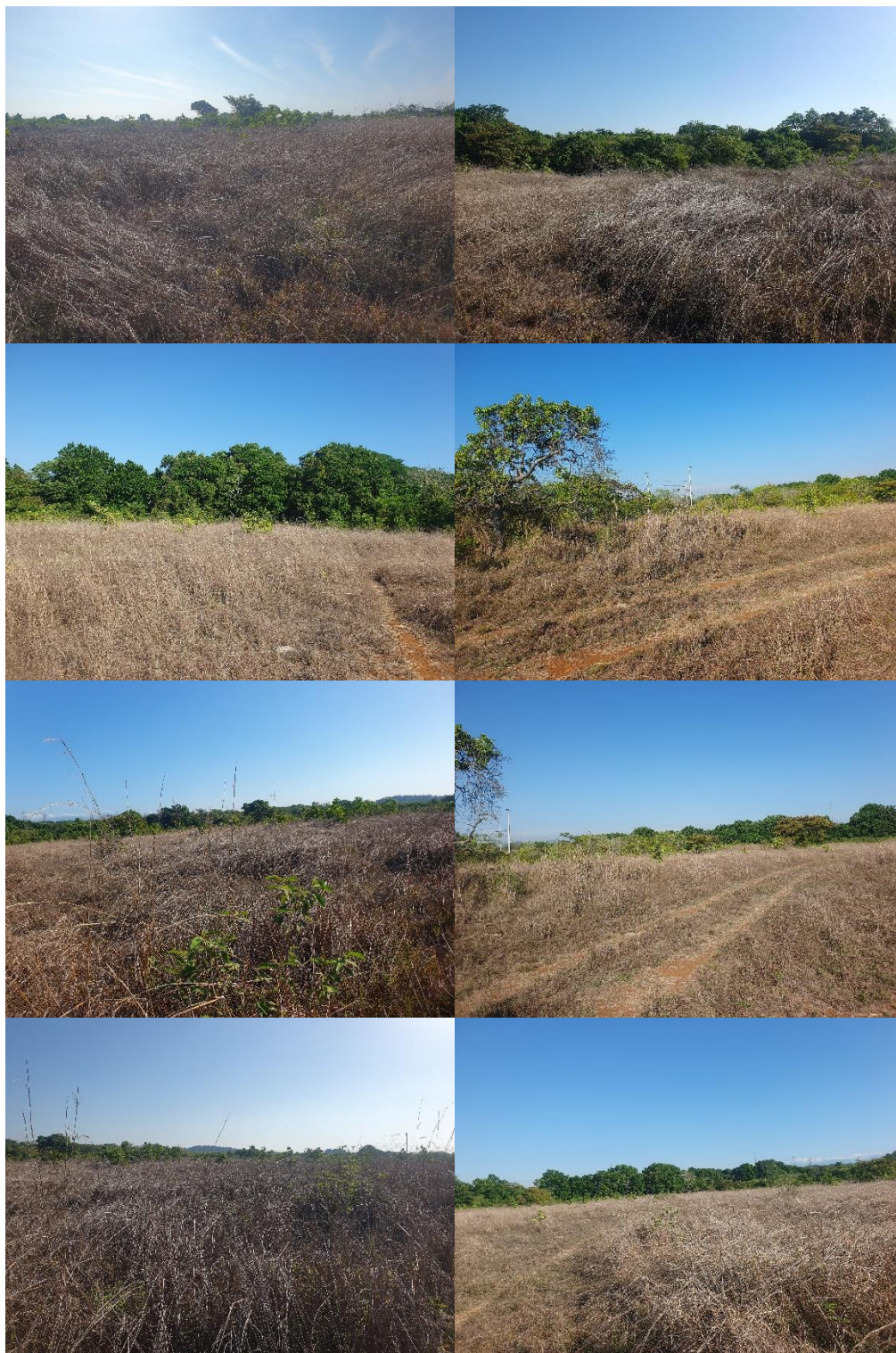
Fotos N° 1, 2, 3, 4, 5, 6, 7, 8, 9,, 10, 11, 12, 13, 14, 15, 16, 17, 18, 19, 20, 21, 22, 23, 24, 25, 26, 27, 28, 29, 30, 31, 32, 33, 34, 35, 36, 37, 38, 39 y 40: Vistas generales. Tramo prospectado. El terreno prospectado en zona rural tiene una topografía ondulada con vegetación seca y árboles. Se encontraron restos de un vehículo y está delimitado por una cerca artificial.