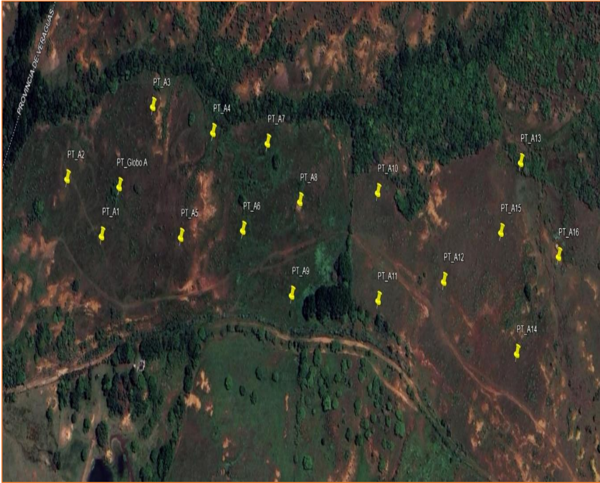
Vista Satelital N° 1. Proyecto “PLANTA FOTOVOLTAICA JAGÜITO GREEN ENRGY III”