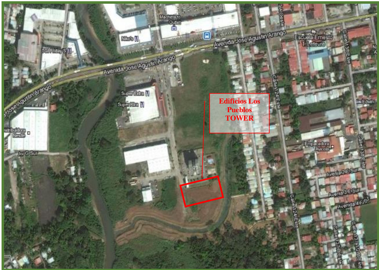
Vista Satelital de la ubicación del Proyecto