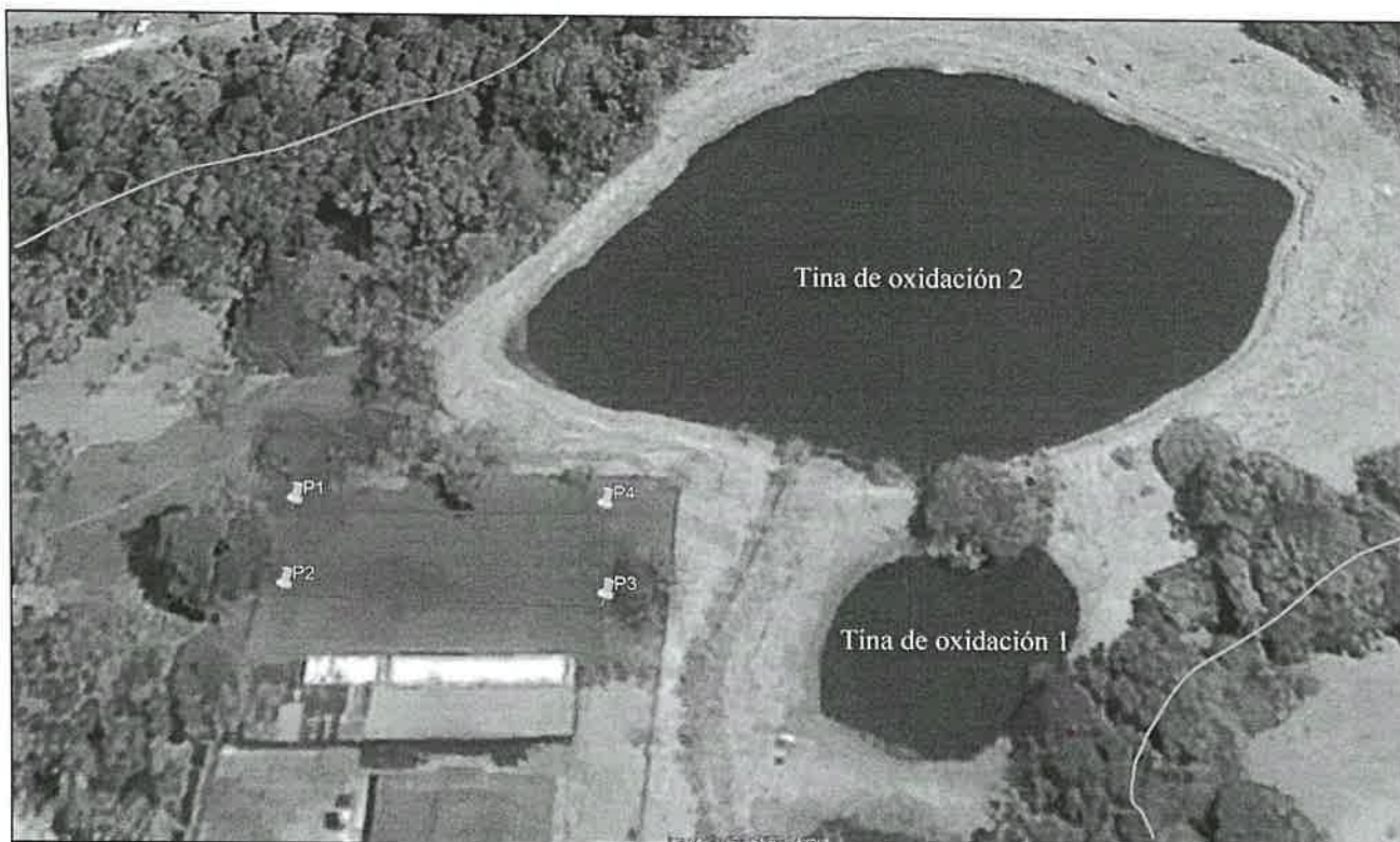
Imagen No. 3. Vista satelital de Google Earth donde se muestra el polígono en evaluación y fuentes hídricas cercanas.