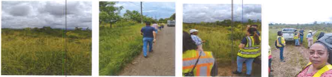
Foto de las listas de asistencia de los participantes de la inspección: