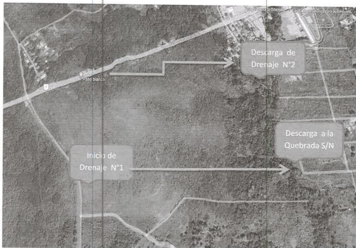
Imagen N° 1