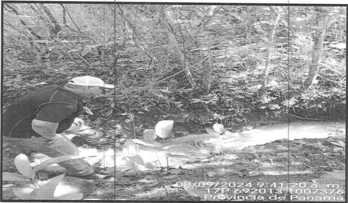
En la Foto N° 3 se observa los remanentes de aguas empozados en algunos tramos del drenaje. INFORME TÉCNICO No. 016-2023.