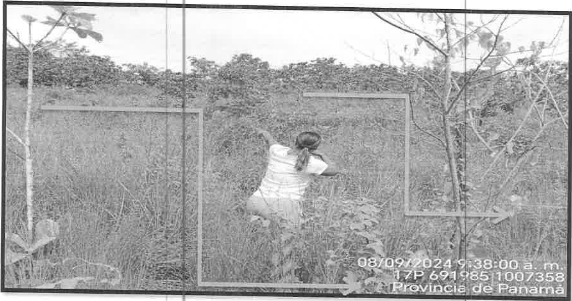
En la Foto N° 1 y 2 se observa la inclinación del terreno donde empieza el drenaje.