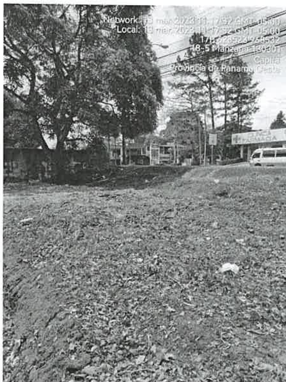
Imagen 1. Polígono con varios árboles frutales.